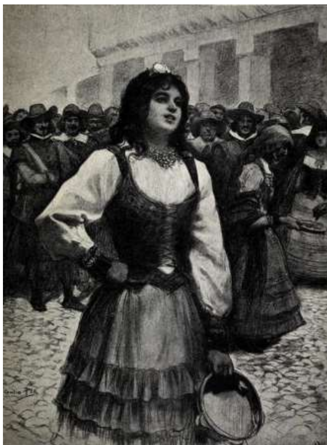
Blanco y Negro, 1899, Creaciones Femeninas VI, La Gitanilla, Cecilio Pla.

Día pleno de otoño. Aparece en mis pensamientos el mes de noviembre con formas distintas. Todo está en mi frágil memoria, sobre todo, los sonidos de aquella música que me ahogaba, acompañada de profundas palabras. Fue breve, se mantiene y perdura en el tiempo.