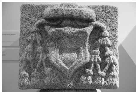
Figura 3. Capitel procedente del patio del hospital de la Piedad. Museo de las Ferias, Medina del Campo.