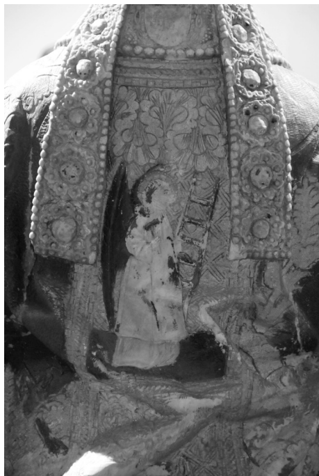
Figura 7. Ángeles con arma Christi. Efigie funeraria de Lope de Barrientos. Museo de las Ferias, Medina del Campo.