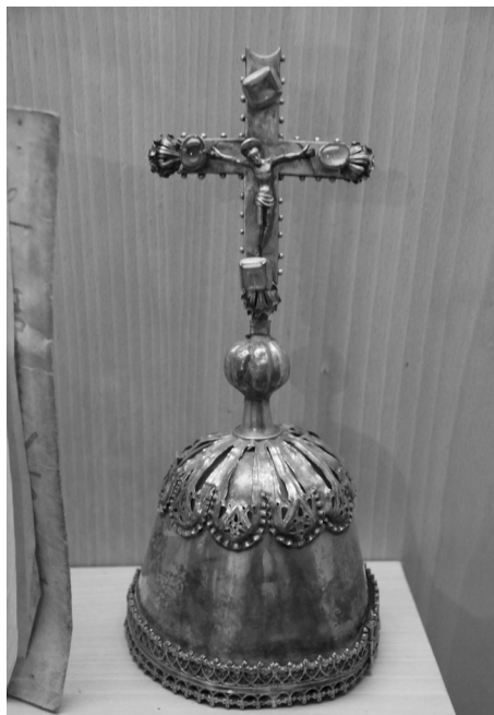
Figura 13. Cruz-relicario. Museo de las Ferias, Medina del Campo.

del siglo XV castellano como, por ejemplo, el convento de Escalaceli –el primer cenobio dominicano castellano observante, fundado en 1423 en plena sierra cordobesa por el beato Álvaro de Córdoba, confesor de la reina Catalina de Lancaster y vicario general de los primeros conventos observantes de la Provincia de España– habría albergado el primer viacrucis de Europa. A ello habría que añadir la presencia de los arma Christi y las Cinco Llagas en los vanos del claustro del Moral de Santo Domingo el Real de Toledo. En definitiva, todos estos motivos remitirían, a fin de cuentas, a las prácticas penitenciales promovidas en contextos reformistas, cuyo fin último habría de ser la imitatio Christi 101 .