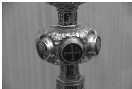
Figura 12. Detalle. Cáliz de Barrientos. Museo de las Ferias, Medina del Campo.