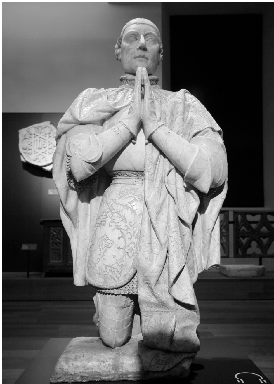
Figura 6. Estatua orante de Pedro I de Castilla. Museo Arqueológico Nacional, Madrid.