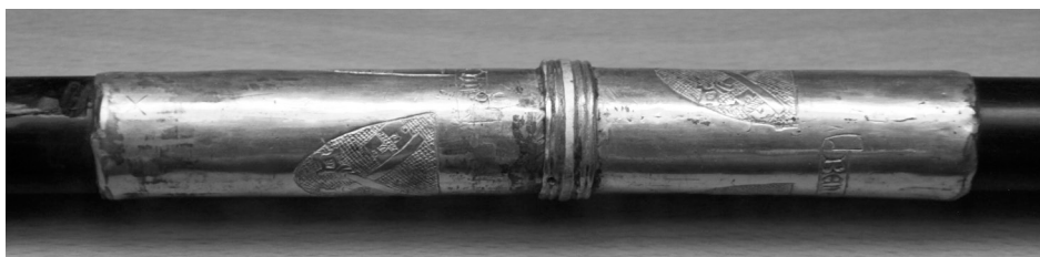
Figura 10. Báculo de san Antonio Abad. Museo de las Ferias, Medina del Campo.

muerte, y que tiene grabado un fragmento de un refrán castellano: «DE DYOS · VYENEL · BYEN · E DELLAS · AVEIAS · LA MYEL · E DE LA · MA[...]» 90 . Si los citados motivos heráldicos hacen alusión a los anteriores propietarios de la reliquia 91 , es posible que Barrientos la hubiese recibido de manos del propio Benedicto XIII con motivo de su, ya mencionada, visita a Morella en 1414.