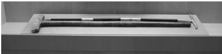
Figura 9. Báculo de san Antonio Abad. Museo de las Ferias, Medina del Campo.