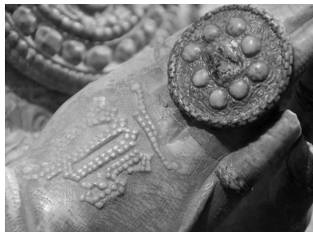
Figura 5. Guantes. Efigie funeraria de Lope de Barrientos. Museo de las Ferias, Medina del Campo.

de ejecución de la efigie funeraria, esta pudo haber sido realizada en torno a 1454, y, quizás, encargada entre el 11 de junio de 1454, momento en el que el heredero al trono concedió al prelado el título de fundador del linaje Barrientos, y el 17 de noviembre de ese mismo año, día en el que el obispo dictó su testamento en la villa de Medina del Campo.