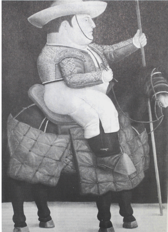
Fernando Botero, Rejoneador , óleo sobre tela

Se escondieron de momento los dictadores y los burgueses, los militares y los obispos; como por ensalmo, desaparecieron de improviso las desnudas mozas, los nuevos ricos patanes y los provincianos poetas de a cinco pesos; monjas y prostitutas, santos y tiranuelos tercermundistas aguardan tras bambalinas una nueva oportunidad para venir a poblar otra vez, con su acostumbrada bobaliconería, el universo pictórico de Fernando Botero