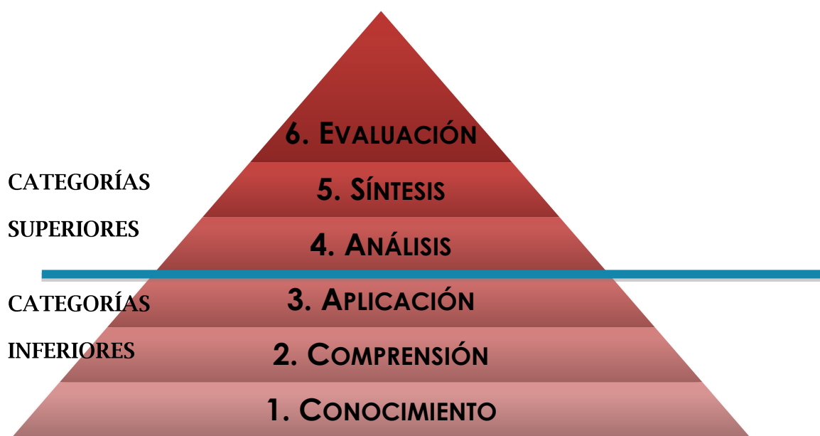
Ilustración 1: Categorías de pensamiento en el Plano Cognitivo, según la Taxonomía de Bloom