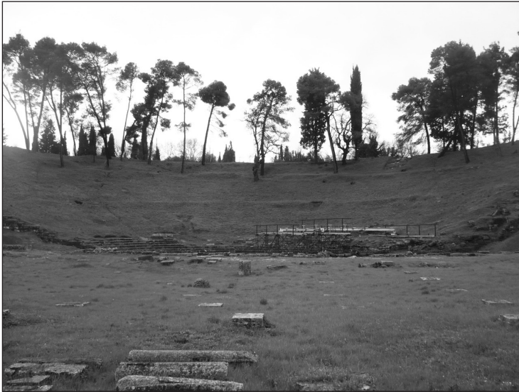
FIGURA 2. Vista del Tersilio y del teatro de Megalópolis desde el norte.

Segundo, lo más probable es que las reuniones de los llamados «Diez Mil» (los Μύριοι, la Asamblea de la Confederación Arcadia; Paus. 8.32.1; Harp. s. v. Μύριοι ἐν Μεγάλῃ πόλει), tuvieran lugar en Megalópolis. No se sabe con exactitud dónde, pero el emplazamiento más probable por tamaño (66,64×52,42 m) y capacidad (cercana a las nueve mil personas), centralidad y representatividad es el Tersilio (Paus. 8.32.1), un edificio emblemático de la nueva urbe que absorbió una buena parte del presupuesto constructivo de la misma, 26 lo cual no es baladí en una ciudad que levantó, entre 360-330, uno de los teatros más grandes de la Grecia antigua, así como una gran ágora monumentalizada (fig. 2). 27