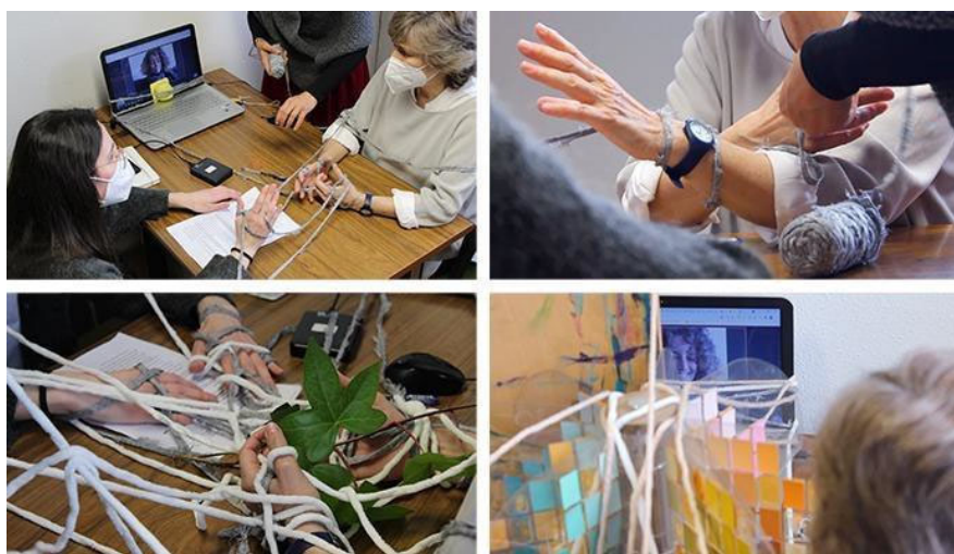
FIGURA 3. Contra(entre]vista #2 - Entramadas, 13/05/2021

Fuente: elaboración propia. Contra(entre]vista #2 - Entramadas (capturas de pantalla). 2:52 minutos. https://youtu.be/tyuL4GnrxE