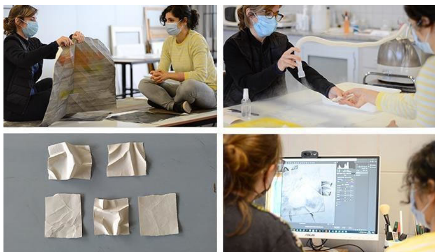
FIGURA 4. Contra(entre]vista #3 - Creación-Restauración en tres tiempos, 24/05/2021

Contra(entre]vista #3 - Creación-restauración en tres tiempos (capturas de pantalla]. 2:24 minutos. https://youtu.be/0tIrm-ug9bY