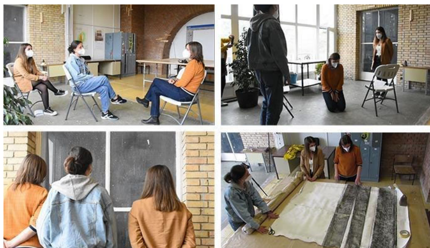
FIGURA 2. Contra(entre)vista #1 - Sobre registros y mordidas, 30/04/2021

Fuente: elaboración propia. Contra(entre)vista #1 - Sobre Registros y mordidas (capturas de pantalla). 4:05 minutos. https://youtu.be/FboQ2QjYH9c