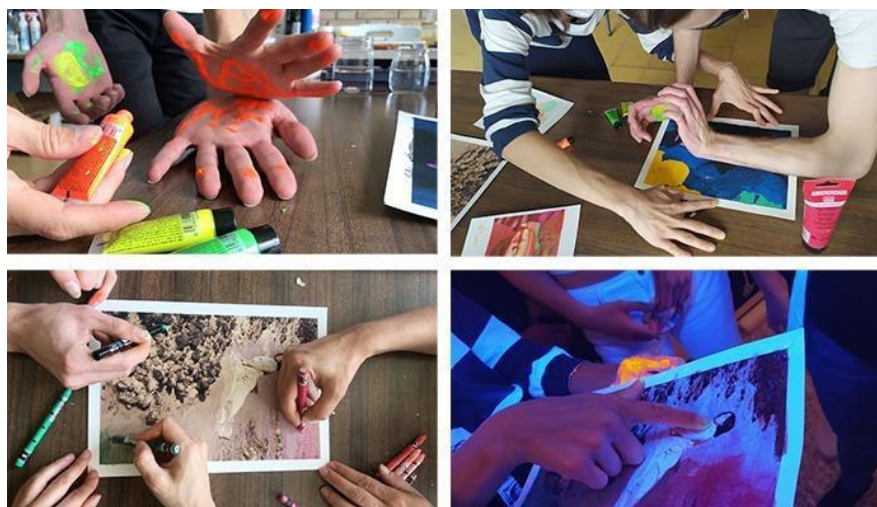
FIGURA 5. Contra(entre)vista #4 - Co-crear partiendo de la materia, 21/05/2021

Fuente: elaboración propia. Contra(entre)vista #4 - Co-crear partiendo de la materia (capturas de pantalla). 3:21 minutos. https://youtu.be/l7xTnWAuzRc