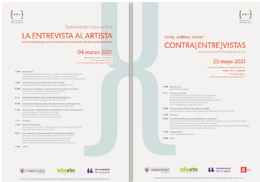
FIGURA 1. Cartelería de difusión de los seminarios formativos

Seminario La entrevista al artista como metodología de conservación-restauración de arte contemporáneo y Rotar, voltear, volver. Contra(entre)vistas .