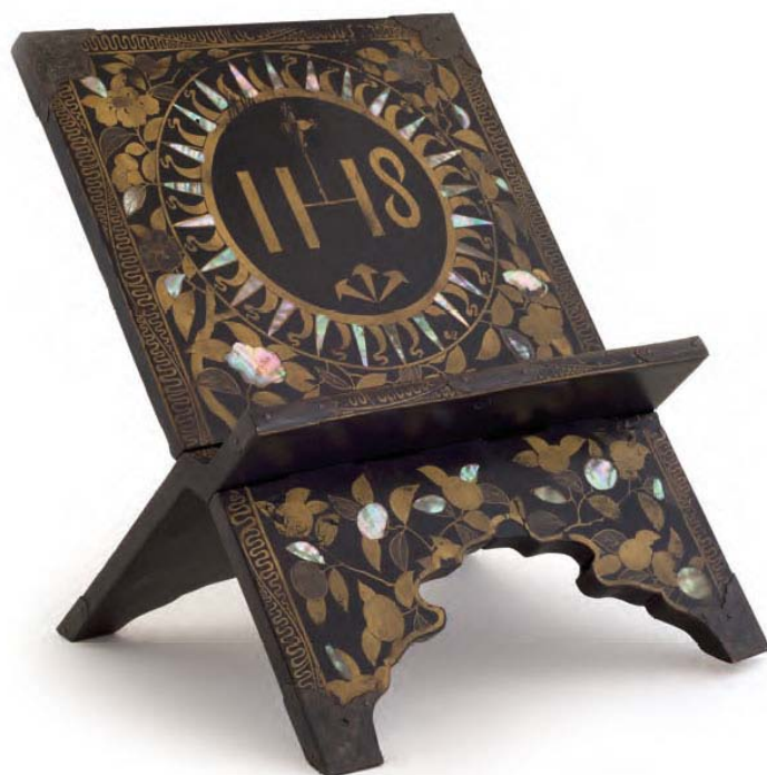
Atril estilo namban , 1580-1614, Japón. Museo Nacional de Artes Decorativas, Madrid.