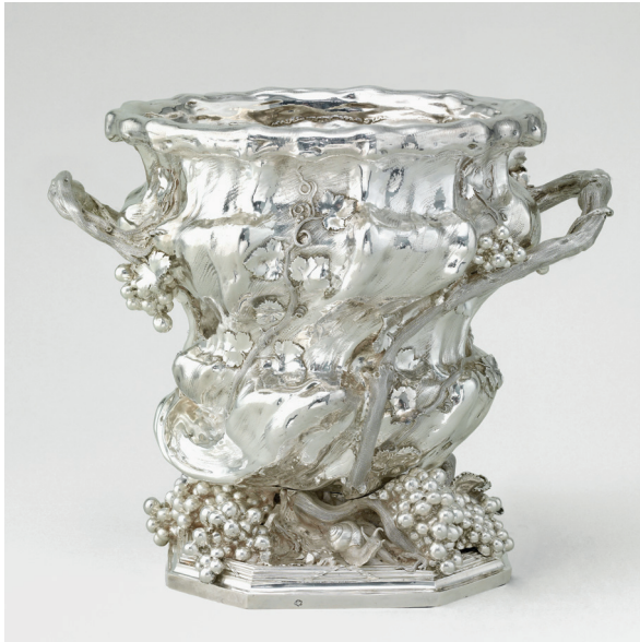
Figura 4. Enfriadera de botellas del servicio Penthièvre-Orleans. París, 1727-28. Thomas Germain (Museo del Louvre, París).