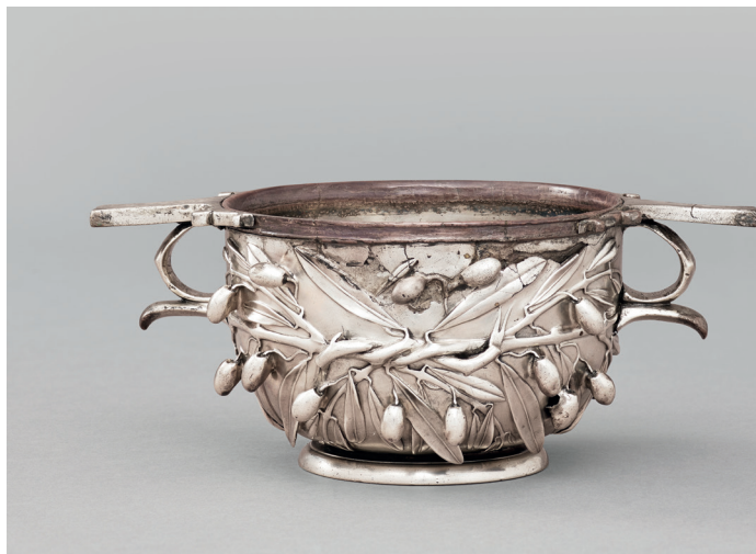
Figura 2. Skyphos . Imperio romano, siglo I (Tesoro de Boscoreale), Museo del Louvre, París.