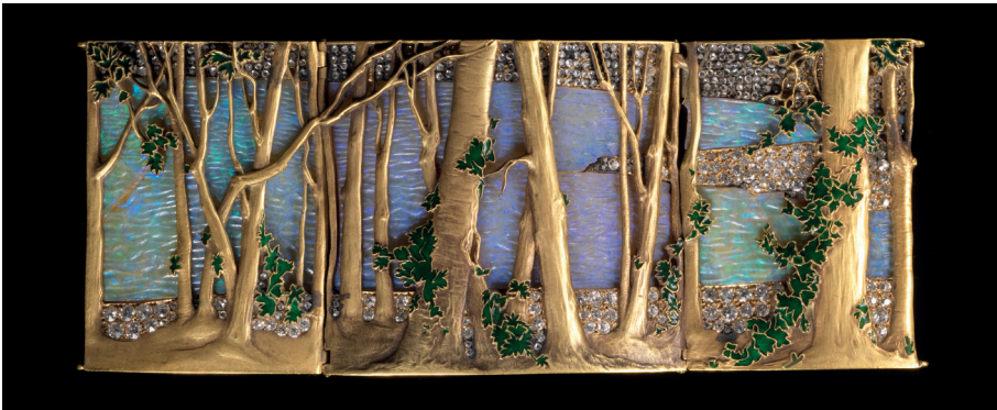
Figura 9. Gargantilla. René Lalique, ca. 1898-99.

en relieve (Colección particular), mientras en otras (Museo Gulbenkian, Lisboa) el marco está formado por un tronco de árbol de hoja caduca de color ennegrecido. Pero, sobre todo, destaca por su originalidad una gargantilla (Museo Gulbenkian, Lisboa) que muestra el encuadre parcial del cauce de un río o un lago rodeado de árboles, éstos en relieve en primer plano con hojas esmaltadas en verde, el suelo pedregoso de las orillas simulado con diamantes facetados, y el agua, de aspecto algo lechoso y brillo irisado, con placas de ópalo imperial (Fig. 10).