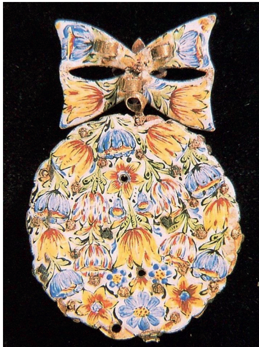
Figura 5. Insignia de la Orden de Alcántara (traseira). España o Sicilia, finales del siglo XVII.

un tono genérico y las gamas cromáticas utilizadas se guiarán sobre todo por cuestiones estéticas: principalmente sobre fondo blanco –aunque los hubo también azules y negros– con la decoración en amarillo, naranja, añil, verde claro, rosa, malva, a menudo con perfilados y moteados en negro. A pesar de su vistosidad, este tipo de decoraciones esmaltadas estuvo relegado, en general, a las traseras en los colgantes y broches de pecho, dejando que las piedras retuvieran el protagonismo del anverso (Fig. 5). Si bien en algunos casos también se combinaron con el material gemológico en algunos pendientes y sortijas, y fueron una opción preferente para adornar los relojes de cadena, algunos complementos de moda y también piezas de colección, principalmente cajas (usadas como tabaqueras o cajas de rapé, o simplemente atesoradas como objeto de vitrina). En algunos casos, las traseras de los broches de pecho se decoraron, en cambio, con preciosas labores grabadas a buril reproduciendo flores y hojas.