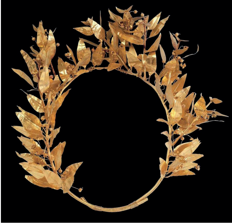
Figura 1. Corona de mirto. Tesalónica, último cuarto del siglo IV a. C. (procede de la necrópolis de Derveni).

Fuente: © Archaeological Museum of Tessaloniki (inv. n° B138).