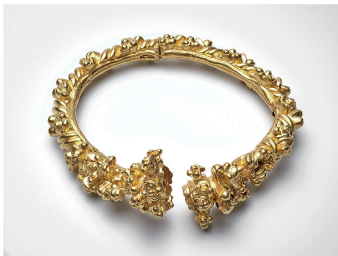
Figura 3. Torque. Cultura celta, siglo IV a. C. (procede de Lasgraisse, Francia), Museo Saint-Raymond, Toulouse (inv. n° 25043).