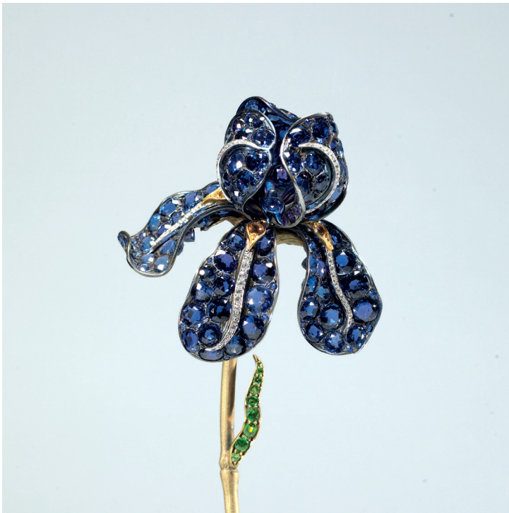
Figura. 7. Broche «Iris». Nueva York, 1900. Tiffany's.

Boucheron, Tiffany, René Lalique y otros diseñadores, produjeron entre 1880 y 1914 brazaletes, broches, peinetas y diademas reproduciendo sencillas camomilas, pensamientos, orquídeas, crisantemos, lirios, fucsias, lavandas, rosas, hortensias, amapolas, claveles, helechos, cardos, espigas, e incluso vegetaciones insólitas como las algas. Realizados en metales preciosos, con esmaltes, piedras y perlas, pero también en asta y marfil; utilizando a veces materiales gemológicos singulares como los zafiros de Montana cuyo color azul, oscilando hacia el violeta o el malva según el punto de luz, resultó ideal para reproducir un lirio iris (Walters Art Gallery, Baltimore) en un broche de Tiffany (Fig. 7); o las perlas biwa de agua dulce en otro de la misma firma para formar los pétalos de un crisantemo (Colección particular). También se modelaron en pasta vítrea translúcida con resultados muy atractivos, especialmente en los diseños de René Lalique.