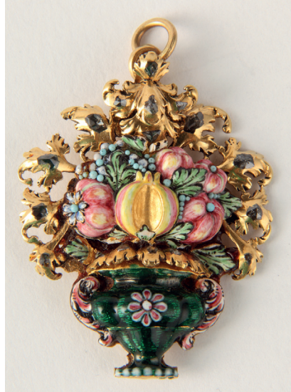
Figura 6. Colgante. España, ca. 1700.

Por otra parte, hay dos motivos introducidos durante el Barroco que serían igualmente distintivos en adelante del repertorio naturalista. Uno es el jarrón con flores, que parece ser una proyección directa del subgénero creado por la pintura flamenca a comienzos del siglo XVII. En las piezas de platería dio lugar a ramilletteros con vasos en forma de jarra y flores de apariencia diversa, trabajadas en general con delicadeza intentando emular su consistencia natural. Con ellos se adornaron desde entonces sobre todo altares y carrozas procesionales, y más excepcionalmente se hicieron algunos objetos de colección en los que la pieza incluía esmaltes, piedras preciosas y perlas, como la pareja conservada en el Kunsthistorisches Museum de Viena. En el caso de las joyas puede citarse el ejemplo de un colgante español fechado hacia 1700 (Museo Nacional de Artes Decorativas, Madrid), en el que el jarrón no incluye flores sino una hojarasca de acanto labrada en oro y salpicada de diamantes, además de unos frutos esmaltados en delicados tonos pastel (Fig. 6). En la simbología católica, el jarrón de azucenas es símbolo de la virginidad de María, y como tal aparece incluido en algunas joyas destinadas a engalanar las imágenes que la representan, particularmente las ricas coronas que fue costumbre realizar para las más veneradas a partir del siglo XVI.