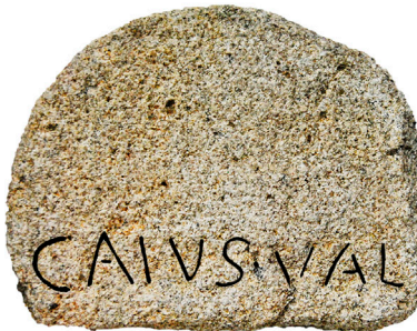
FIG. 1 - Vista superior y frontal de la cabecera de estela del Museo Etnográfico de Don Benito.