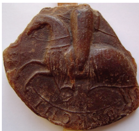
Image 6-9 Sceaux de Pierre le Catholique (août 1203-avril 1204). A.N.F., J 589, Aragon II, n° 1 et Archives de l'Abbaye de Poblet, Parchemins de la Chartreuse de l'Escaladei, S-32.