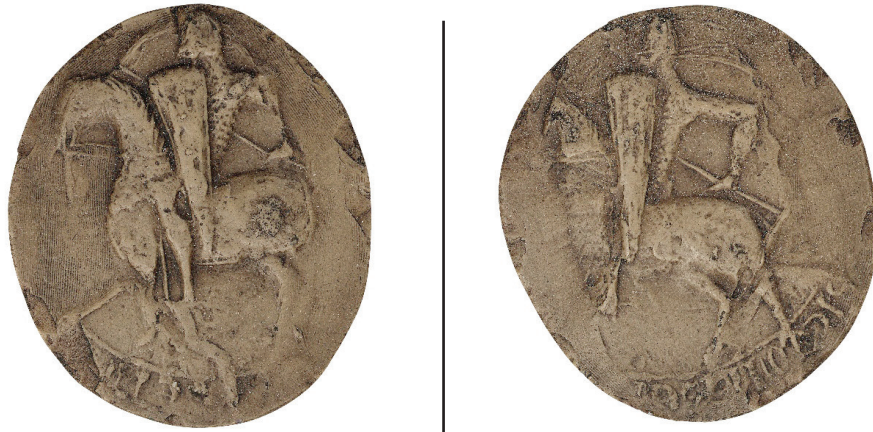
Images 4-5 Sceaux du comte Alphonse II de Provence (Millau, avril, 1204), A.N.F., Sc/D 1105-1105bis.

Très célèbre, le sceau de Raimond VI a fait l'objet d'une très récente étude. 3 Celui d'Alphonse II est aussi connu, mais il convient d'en livrer un cliché (Images 4-5). 4