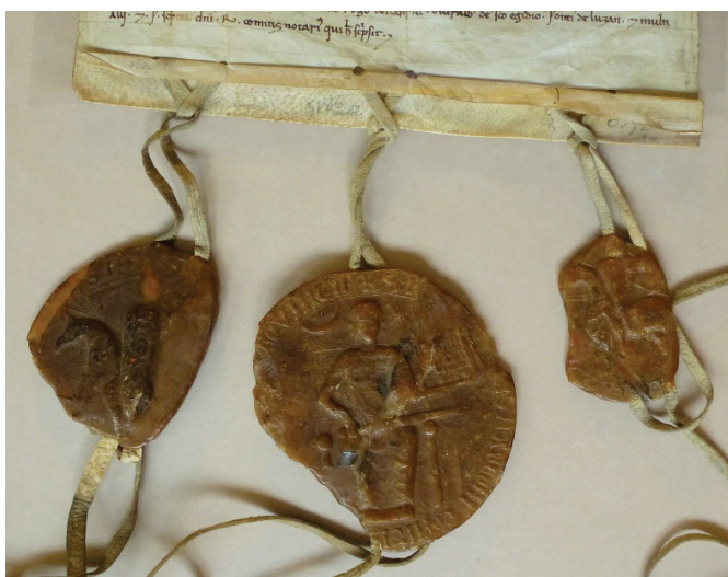
Images 2-3 Sceaux de l'acte d'engagement des comtés de Millau et Gévaudan (Millau, avril, 1204). A.N.F., J 589, Aragon II, n° 1.

Le document est conservé aux Archives de la Couronne d'Aragon (A.C.A.) à Barcelone, section Chancellerie, parchemin n° 184 du roi Pierre le Catholique (Image 1). Il comporte des marges de près de 20 cm. de chaque côté et son état de conservation est excellent, même si manquent les trois empreintes de sceaux qui lui étaient appendues. On peut penser qu'elles étaient similaires aux empreintes cire conservées dans l'acte d'engagement des comtés de Millau et Gévaudan, daté aussi d'avril 1204 et passé également à Millau (Images 2-3). 2