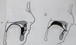
Figura 10.1. Diagrama de la estructura de la cavidad nasal. A) Vista lateral de la cavidad nasal. B) Vista lateral de la cavidad nasal con el seno maxilar.