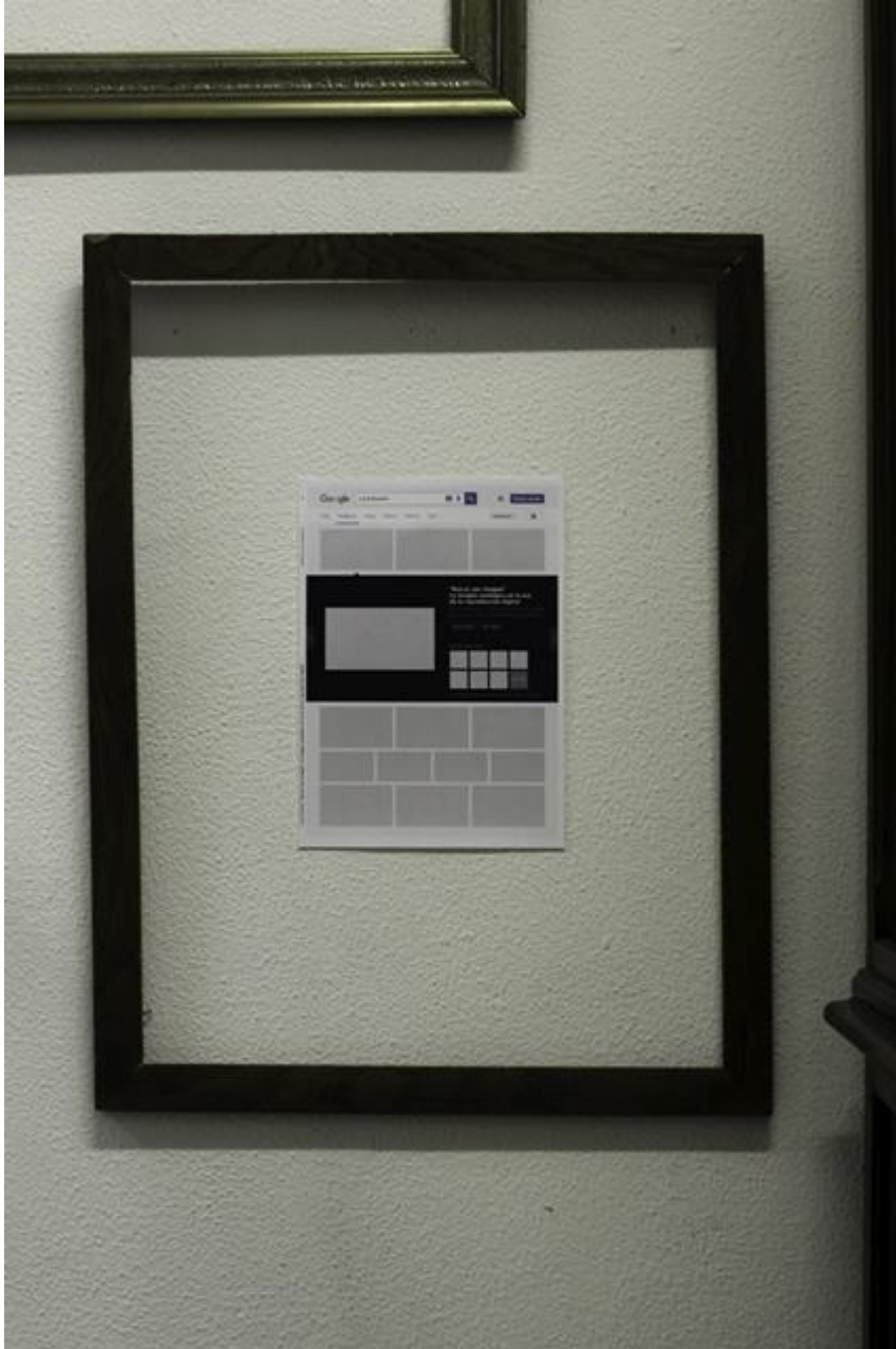
Cubierta de Buscar por imagen , de Lucía Risueño (Madrid, 2016)