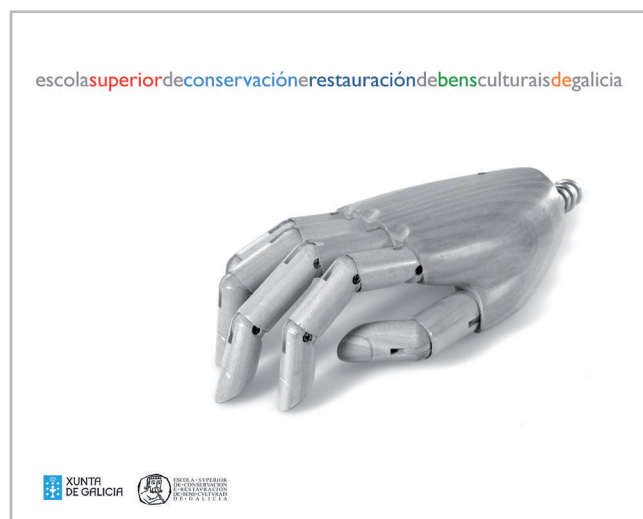
Figura 3. Cabecera de la página web de la ESCRBCG: Escuelas y Facultades, la eterna duplicidad

Pero además, el objetivo de las asociaciones profesionales es fijar el punto de acceso a la profesión en el nivel de máster (7 EQF, 3 MECES). Dicho objetivo responde a las sugerencias y demandas de las asociaciones europeas representativas, tanto profesionales (ECCO) como educativas (ENCoRE).