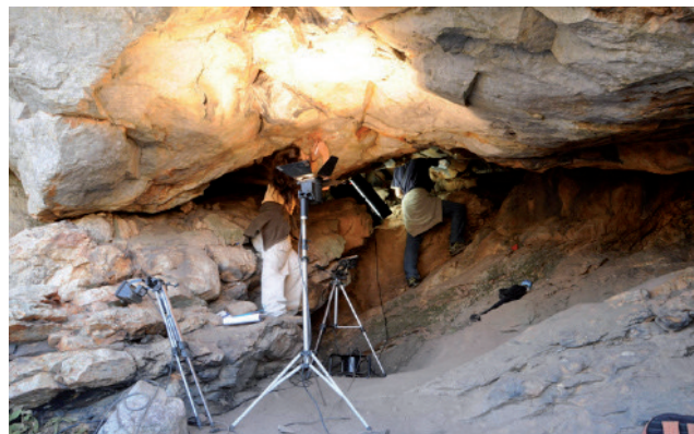
Figura 5. Trabajo profesional