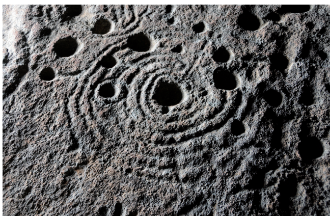
Figura 1. Patrimonio Cultural magnífico, pero sin el suficiente reconocimiento social.

Restauración es la preservación del Patrimonio Cultural en beneficio de las generaciones presentes y futuras. La profesión de la Conservación-Restauración contribuye a la percepción, apreciación y comprensión del Patrimonio Cultural con respecto a su contexto ambiental y su importancia y propiedades físicas.” Dicha definición quedó ratificada en la Declaración de Berlín de 2015, por los 22 países europeos que componen E.C.C.O. y recogida y ratificada por la Declaración de Nájera en 2017, uniendo bajo un mismo marco común a centros educativos y las Asociaciones que defienden la profesión del Conservador-Restaurador cualificado en España. [figura 1]