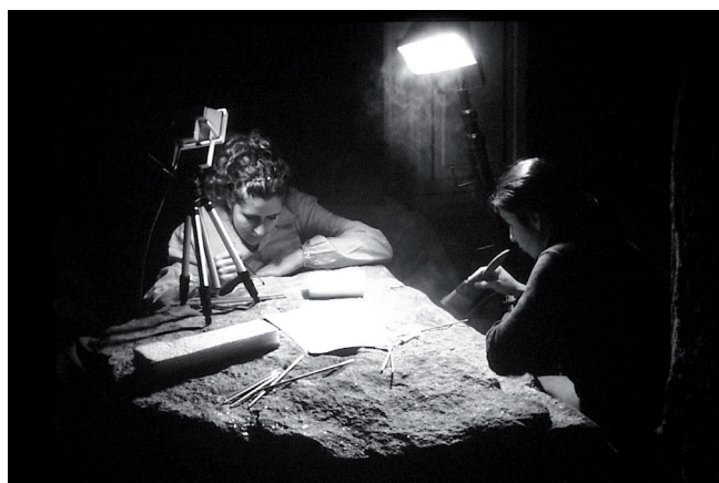
Figura 4. Trabajo profesional

En las fases 1 y 2 se han pretendido esbozar los planes para la ordenación de la formación y titulación.