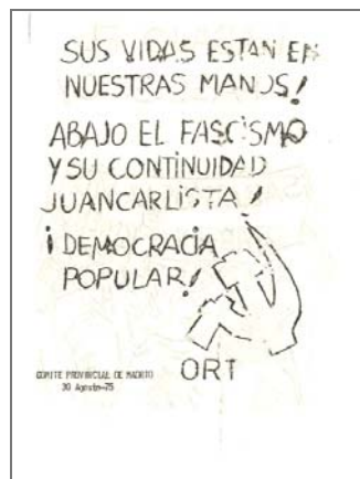
BH SD 5624(243)v.