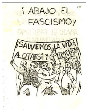
BH SD 5624(243)r.

Comunicado del Comité Provincial de Madrid del P. T. E. llamando a la Huelga General en educación y exponiendo los principales motivos para la misma.