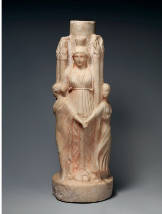
Figura 2. Hekateion con Charites, s. I-II d. C.

Pero Hécate también desarrolla su función protectora sobre el mundo de los hombres, es decir, el del gobierno y la función pública. Para Hesíodo, Hécate cumple un papel primordialmente civilizador y político