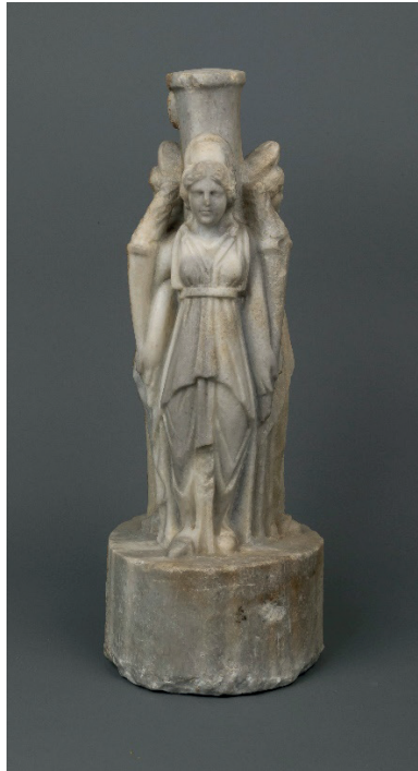
Figura 1. Hekateion, s. II d. C.

iconografía tanto en la historiografía como en la cultura visual, posiblemente aludiendo a sus múltiples poderes. Con el correr de los siglos, su culto sufrió diversos procesos sincréticos que la acercaron a otras divinidades desde el punto de vista iconográfico. Hécate adquirió una gran variedad de atributos, entre los que destacan las antorchas (al igual que Ártemis), los phialai (al igual que Afrodita y Atenea), las llaves (como diosa infernal, relacionada con Hades), los puñales (por su faceta mágica y contaminación con las Furias), serpientes (como divinidad ctónica), etc. 31