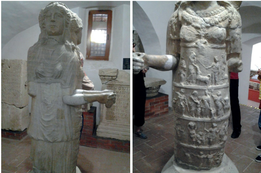
Figura 7 y figura 8. Hekateion, s. IV d. C.

La gran escultura recuperada en la antigua provincia Dacia (s. IV a.C.), representa en su triple forma a la diosa; en una de sus imágenes, Hécate ofrece una serie de registros relivarios en su peplos que parecen ilustrar diversos rituales relativos a sus prácticas místicas (Fig. 7 y Fig. 8). La diosa recibe culto de madres e hijos, a los que una doncella unge. Hermes, Fortuna, Ártemis y un hekateion se identifican fácilmente. Varios personajes sostienen antorchas, cuchillos y animales, posiblemente víctimas propiciatorias. En el último registro, se aprecian a las tres Gracias danzando junto a un cuarto personaje (¿una iniciada en el culto?; ¿Hécate?). Exceptuando a Hermes, todas las figuras que intervienen en esta compleja composición son femeninas, subrayando la importancia de Hécate como diosa protectora de la mujer.