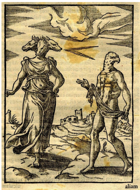
Figura 3. Vincenzo Cartari, «Hécate» en Le Immagini con la sposizione dei dei de gli antichi, 1556-1560.