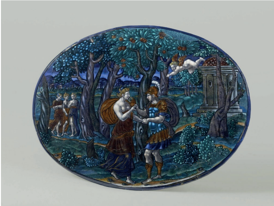
Figura 9. Medea y Jasón, plato cerámico esmaltado, c. 1570-1600

La diosa se presenta como intercesora entre Medea y Hades, cuando su amado Jasón le pide que le quite a él años de juventud para dárselos a su padre, Esón. Medea reconoce que no puede realizar tal proeza, pero sí recuperar la vida de años anteriores. Ella siempre impone a Hécate como su intermediaria, su ayudante y su propiciadora; la llama «triforme» y realiza un altar hecho de turba, cubierto por hojas, para sacrificar una oveja negra. El texto de Ovidio ofrece un relato completo de todas las hierbas y sustancias que utiliza Medea, y en él es posible ver cómo Hécate enseña a su hija/sacerdotisa a manipular y gestionar los recursos de la naturaleza con el fin de influir en el devenir de su destino 47 .