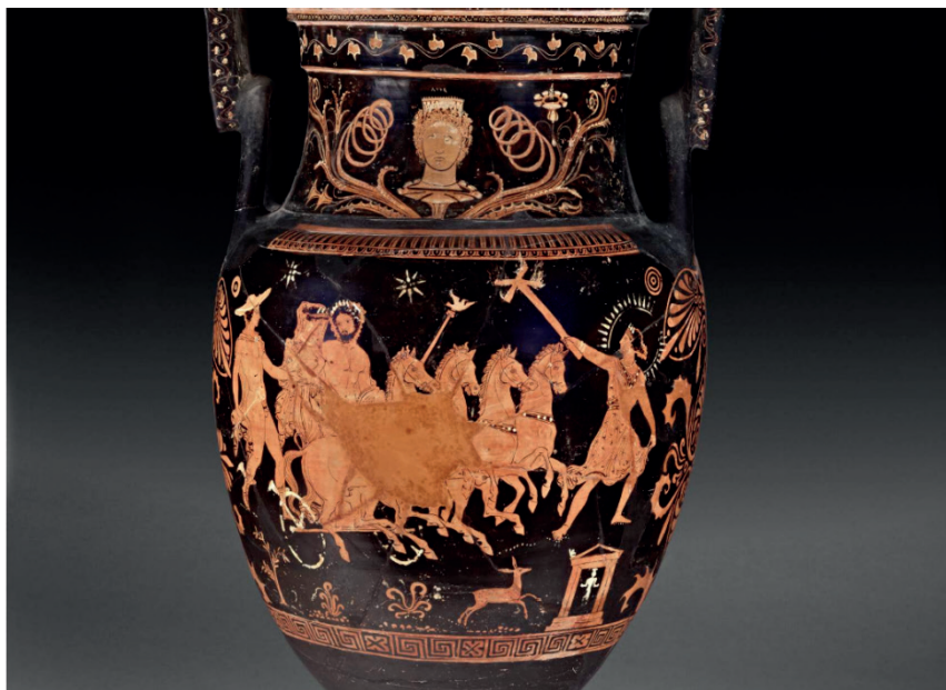
Figura 5. Crátera de figuras rojas, s. iv a. C.

La función de Hécate como protectora de caminos se solapó a la de Hermes, no solo en el aspecto cultural sino también en su iconografía: las hermai . Dicho prototipo, creado también por Alkámenes en el s. v a. C., estaba situado en los propileos de la Acrópolis ateniense, con una clara función apotropaica 39 aunque también práctica: la de limitar el terreno, cuestión de suma importancia en el s. vi a. C. con la expansión hacia otros territorios y el nacimiento de la poleis . Asimismo, asociándose a Hermes Propyleo , Hécate se erigió como protectora de las entradas: en Grecia y Roma se han hallado pequeños hecatea en las puertas de los hogares y santuarios siguiendo esta tradición (Fig. 6).