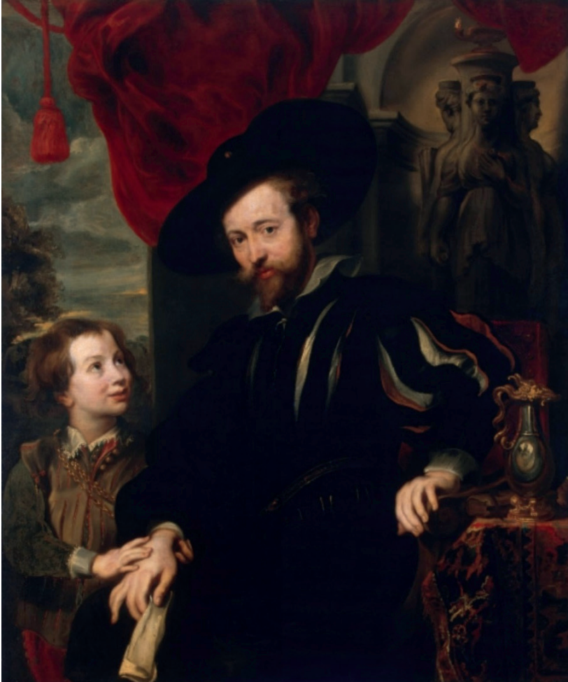
Figura 4. Pedro Pablo Rubens (escuela), Retrato del pintor y su hijo , óleo sobre lienzo, c. 1650.

Un reciente estudio realizado desde la perspectiva ecofeminista ha puesto en relación el hekateion con una serie de performances realizadas por artistas femeninas en la década del 70 del pasado siglo, incursiones que se han inscrito dentro las tradiciones del body art encarnando la figura de la «mujer-árbol» 35 . Para algunos autores, la triplicidad de Hécate está fuertemente