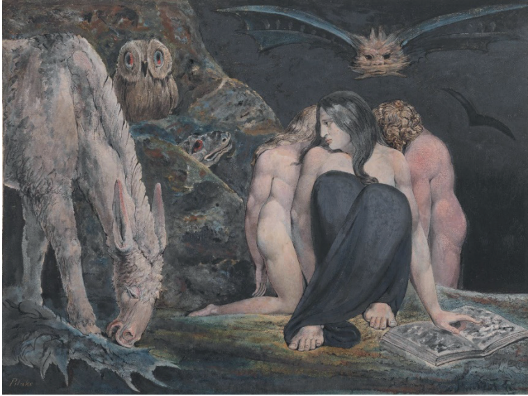
Figura 12. William Blake, The Night of Enitharmon's Joy (Hécate) , c. 1795.

La figura de Hécate como diosa panthea , señora de la luz y de la oscuridad, ha sido recuperada recientemente por movimientos neopaganos y la Wicca, caracterizados por el sincretismo de diversas creencias no occidentales 56 . Asimismo, las corrientes ecofeministas surgidas a partir de la obra fundacional de Carolyn Merchant (1980), las cuales equiparan la dominación de la naturaleza a la de la mujer, han puesto de relevancia el interés por esta divinidad, a la que las fuentes literarias antiguas definen como la diosa de la magia, los fantasmas y la muerte, pero también la relacionan con la naturaleza domesticada 57 .