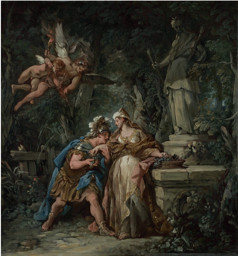
Figura 10. Jean-Francois de Troy, Jasón jurando amor eterno a Medea , óleo sobre lienzo, 1743-6. Fuente: National Gallery, NG6330, Londres. https://www.nationalgallery.org.uk/paintings/jean-francois-de-troy-jason-swearing-eternal-affection-to-medea

Jasón y los Argonautas– decoraban infinidad de obras de arte en distintos soportes, especialmente aquellos que permitían una fácil portabilidad, como las artes decorativas, ya que eran muy apreciadas por los viajeros que se hallaban realizado en Grand Tour. El plato cerámico con esmaltes de Limoges (c. 1570-1600) muestra a Jasón vestido como un general romano recibiendo las pócimas prometidas por Medea, mientras con la otra mano representan la dextrarum iunctio –las manos entrelazadas– simbolizando el matrimonio (Fig. 9). Al fondo, el templo de Hécate sacraliza la unión, de la que son testigo tres jóvenes situadas en un segundo plano, posible representación de la diosa triforme.