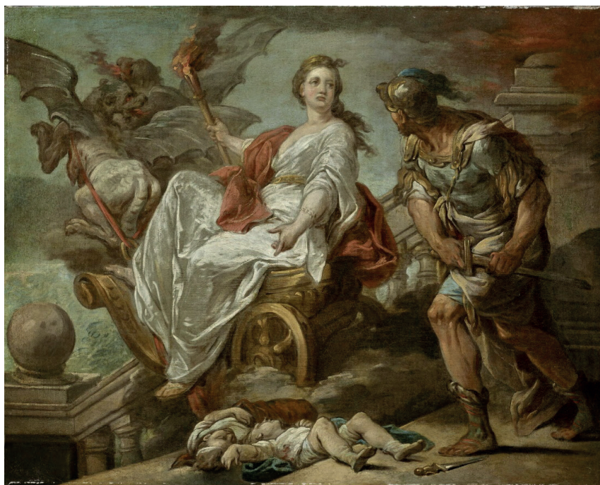
Figura 11. Escuela de Charles-André Van Loo, Medea y Jasón , 1700/1800. Fuente: Musée du Louvre, MI 1416; 872 5 18. https://collections.louvre.fr/en/ark:/53355/cl010055021

convierte en un atributo común en ambas. Este aparece llevando a Medea –quien sostiene una antorcha– luego de matar a su progenie en un lienzo atribuido a la escuela de Charles-André Van Loo (1700-1800) (Fig. 11).