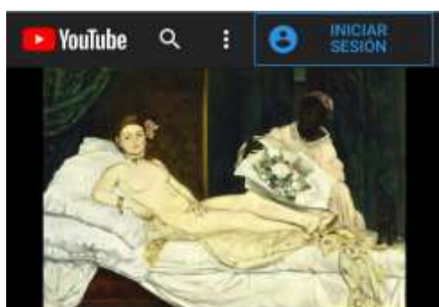
"Olympia" (1863) de Manet | ARTENEA- Obras comentadas 402 visualizaciones

https://www.youtube.com/user/ArteSigloXX/