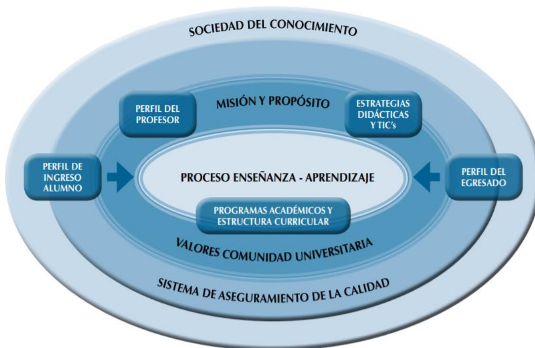
Figura 2. Componentes del Modelo Educativo Institucional UTA.