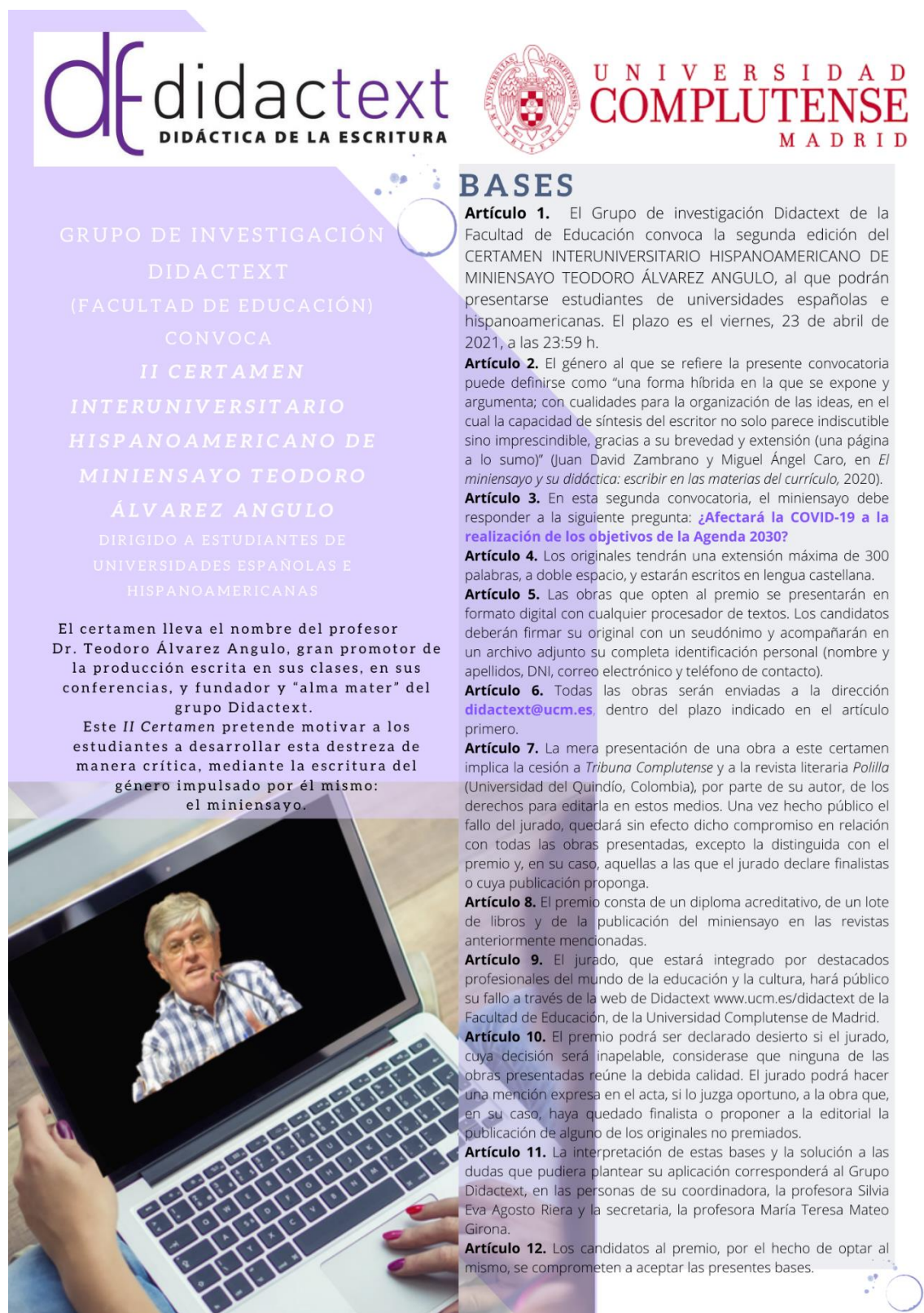
Imagen 1. Cartel de promoción del II Concurso