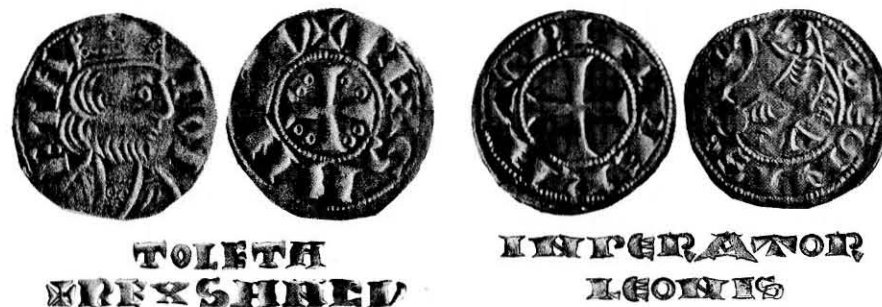
Fig. 5. Kongeriget Kastilien, Sancho III (1157-1158), penning, Toledo? 1157-august 1158. Legeret sølv. Vægt 0,94 g, diameter 18 mm. Forsideindskrift: TOLETH REX SANCII. Bagsideindskrift: + REX SANCI. Oversættelse: Toledo (i flertal), Kong Sancho. 6 eksemplarer kendt. Samling León España. 1,5:1.