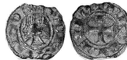
Fig. 3. Kongeriget Leon, Ferdinand II (1157-1188), penning, Leon, oktober 1157-januar 1158. Legeret sølv. Vægt 0,92 g, diameter 18 mm. Forsideindskrift: REX LEO Bageindskrift: + REX D LENO (sic). Oversættelse: Leons konge, konge, hersker over Leon. 8 eksemplarer kendt. Samling León España. 1,5:1.