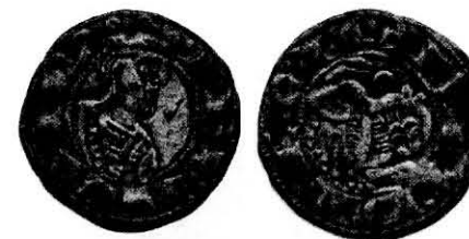
Fig. 4. Kongeriget Leon, Ferdinand II (1157-1188), penning, Oviedo, juni 1158-slutningen af august 1158. Legeret sølv. Vægt 0,87 g, diameter 18 mm. Forsideindskrift: FERNAND'. Bageindskrift: + REX D LEO. Oversættelse: Ferdinand, konge, hersker over Leon. Unik. Gabinete de Antigüedades de la Real Academia de la Historia. 1,5:1.