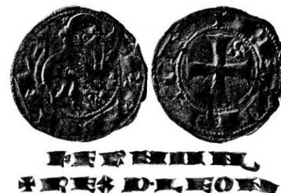
Fig. 1. Kongeriget Leon, Ferdinand II (1157-1188), penning, Salamanca, sandsynligvis juli 1158-slutningen af august 1158. Legeret sølv. Vægt 0,68 g, diameter 18 mm. Forsideindskrift: FERNAND. Bagsideindskrift: +REX D·LEON. Oversættelse: Ferdinand, konge, hersker over Leon. KMMS, Thomsen 2691. (a) Tegning: fra Erslev 1873, nr. 2691. 1,5:1.