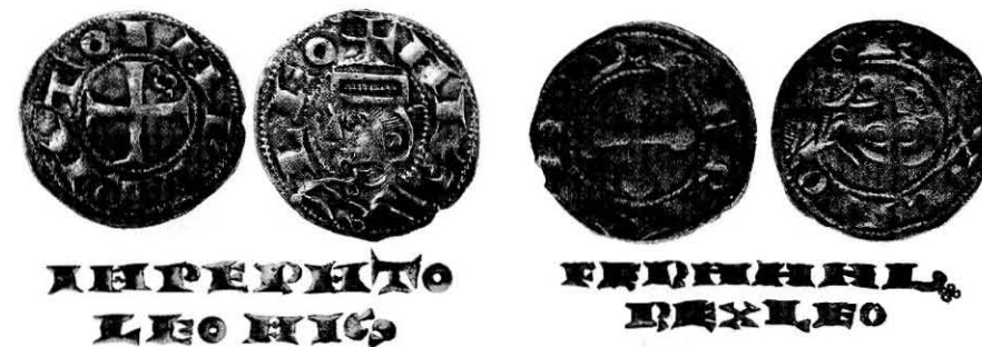
Fig. 6. Kongeriget Kastilien-Leon, Alfons VII (1126-1157), penning, Salamanca, ca. 1147-ca. 1150. Legeret sølv. Vægt 0,92 g, diameter 18 mm. Forsideindskrift: IMPERATO LEO NIS. Bagsideindskrift: LEO NIS. Oversættelse: kejser af Leon. 9 eksemplarer kendt. Samling Museo Provincial de Valladolid, exp. 1990-9/53-1085. 1,5:1.