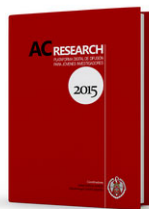
FIGURA 2. Imagen de las publicaciones AC Research 2015 y 2016.