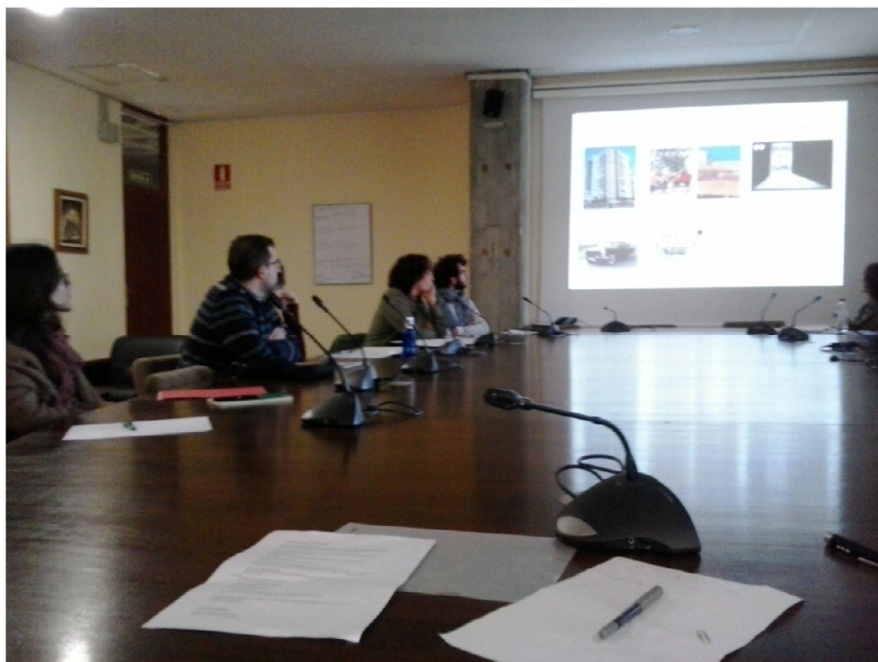
FIGURA 1. Detalle de la sesión de presentación del Seminario de Innovación Docente AC Research. Plataforma digital de difusión para Jóvenes Investigadores. Facultad de Ciencias de la Información de la Universidad Complutense de Madrid. Madrid, 12 de diciembre de 2014.