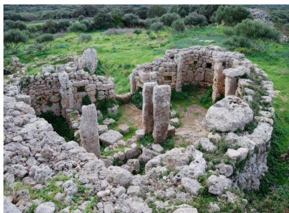
Fig. 1: Santuario central de So na Caçana.

So na Caçana es un lugar arqueológico ideal para iniciar una Investigación sobre el uso del espacio geográfico insular durante la Prehistoria, Protohistoria e Historia menorquinas. La prolongada ocupación temporal de este promontorio, en el que se localiza desde una significativa necrópolis del Bronce Medio (s.XVIII a.C.- s.XV a.C.), hasta un conjunto etnográfico representativo de la arquitectura rural tradicional local sin que aparentemente haya muestras de abandono de este sitio durante al menos 3.500 años.