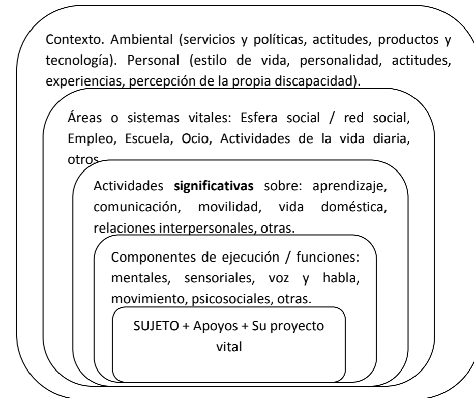
Figura 1. Intervención multidisciplinar centrada en la persona.

Una alta demanda asociada a la discapacidad, un bajo control sobre la situación y un bajo o nulo apoyo social darán lugar a la aparición de estrés familiar con efectos nocivos para la salud, para la satisfacción y para el buen funcionamiento en las distintas esferas: laboral, escolar, familiar, social, personal y función de apoyo a la discapacidad. ¿Qué hacer?