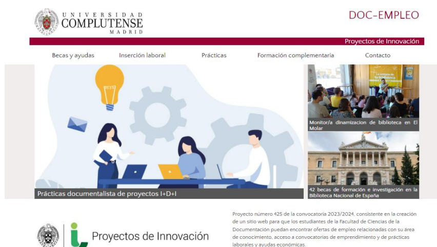
Figura 1. Imagen del sitio web creado para el proyecto.