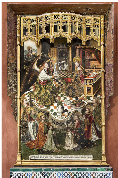
Fig. 2. Pedro de Córdoba. Anunciación con santos y donantes . Mezquita-catedral de Córdoba.