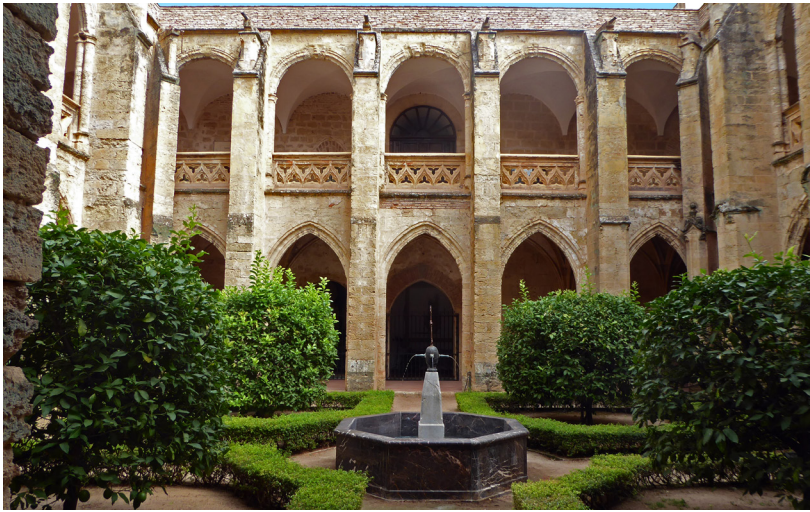
Fig. 3. Claustro principal del monasterio de Valparaíso. Córdoba.

barcelonés en las obras del monasterio cordobés ya había sido advertida por algunos autores 22 , creo que es posible afirmar que hasta la fecha esta no había sido ponderada adecuadamente. Esto se debe a que, en realidad, dicha estancia podría servir para explicar ciertas singularidades que aparecen entre las soluciones arquitectónicas utilizadas en el cenobio y que supondrían, además, una nueva y desconocida vía de penetración del tardogótico en Andalucía.