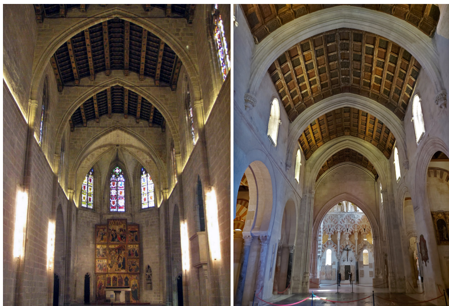
Fig. 10. Izq. Capilla real de Santa Ágata en Barcelona. Dcha. Nave de Villaviciosa en la mezquita-catedral de Córdoba.

a una puerta, en este caso la de la iglesia de San Andrés (fig. 9), la cual sería ejecutada no mucho después de 1489 bajo el auspicio del obispo Íñigo Manrique (1486-1496). Un proyecto que, además de encontrar similitudes en el de Valparaíso –tanto en tracerías como en molduras–, probablemente compartiría maestros con la obra de la nave de Villaviciosa en la catedral cordobesa 44 .