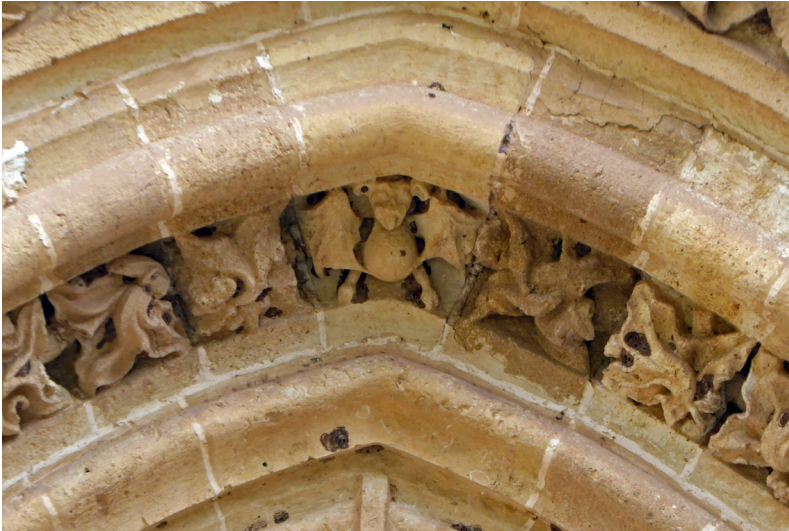
Fig. 6. Murciélago coronando la portada del monasterio de Valparaíso.