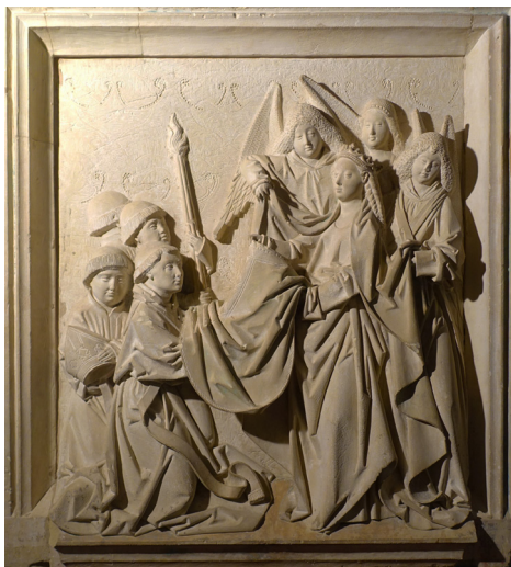
Fig. 1. Atribuido a Egas Cueman. Imposición de la casulla a San Ildefonso. Mezquita-catedral de Córdoba.