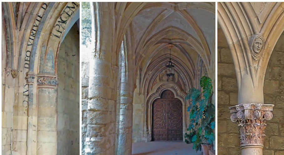
Fig. 4. Izq. Dos detalles del claustro del monasterio de Valparaíso. Córdoba. Dcha. Marc Safont. Detalle del patio de la Generalitat de Barcelona.

Quizá el elemento más llamativo del conjunto, en cuanto a pericia tecnológica se refiere, lo constituya la propia portada del templo. De cronología controvertida 24 , esta presenta singularidades tales como una considerable esbeltez o la presencia de nervios entrecruzados y columnas entorchadas (fig. 5). Sin tratarse de una tipología exclusiva de la corona de Aragón, lo cierto es que la portada conformada por un arco apuntado de poca luz, terminada en gablete y flanqueada por dos altos pináculos fue paradigmática de la arquitectura catalana y mediterránea, al menos desde su utilización en la puerta de Santa Eulalia de la catedral barcelonesa en 1431. Se trataría este de un modelo que hoy sabemos que gozó de tanto éxito que se constituyó en todo un prototipo dentro de la arquitectura de su tiempo. Autores como Joan Domenge y Jacobo Vidal han demostrado que, en una fecha tan avanzada como 1542, aún se pidió al maestro Bernat Salvador que hiciese un nuevo portal para Santa María del Mar siguiendo los modelos de la portada de Santa Eulalia 25 . Pero aún más interesante resulta que, de nuevo, el maestro Marc Safont también utilizase este tipo de vano esbelto y decorado,