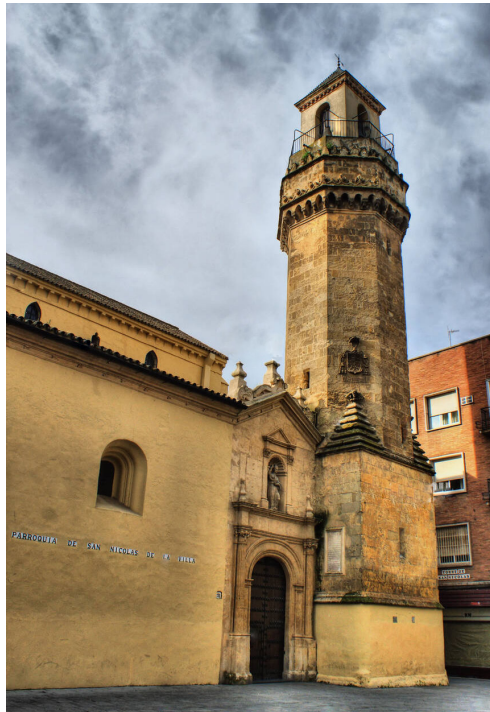
Fig. 11. Torre de la iglesia de San Nicolás de la Villa, Córdoba.

para la liturgia. Edificada hacia 1489 y calificada en su tiempo de “obra tudesca”, la nueva construcción fue muy probablemente patrocinada y supervisada por los propios Reyes Católicos durante su estancia en Córdoba 47 . No podemos olvidar en este sentido que dicha nave servía de prolongación natural de la Capilla Real, lugar que acogía los enterramientos de Fernando IV y Alfonso XI. Al mismo obispo Manrique debemos también el proyecto del pintoresco campanario de la iglesia de San Martín de la Villa en la misma ciudad (fig. 11). Una torre fechada en 1496 y dotada de singular planta octogonal –de nuevo excepcional en territorio castellano–, que incluía en sus muros una potente advertencia visual a los aristócratas vecinos en forma de esculturas grotescas y sendas inscripciones con los lemas patientia y obedientia 48 .