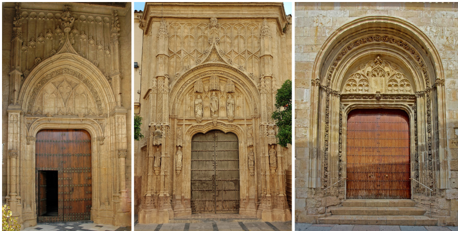
Fig. 9. De izquierda a derecha: portadas del monasterio jerónimo de Santa Marta, del hospital de San Sebastián y de la iglesia de San Andrés en Córdoba.