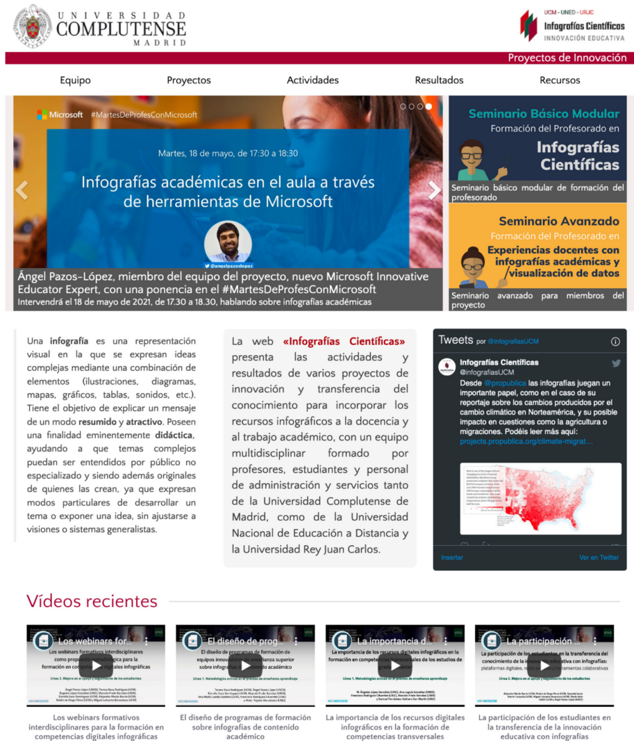
Figura 1. Sitio web de la Red sobre Infografías Científicas.

Los contenidos educativos y novedades (Figura 1), un canal de comunicación en Twitter ( @infografiasUCM ) junto a diversos programas de actividades, acciones formativas y resultados científicos desarrollados gracias al trabajo conjunto entre profesores, investigadores, técnicos de gestión y estudiantes colaboradores.