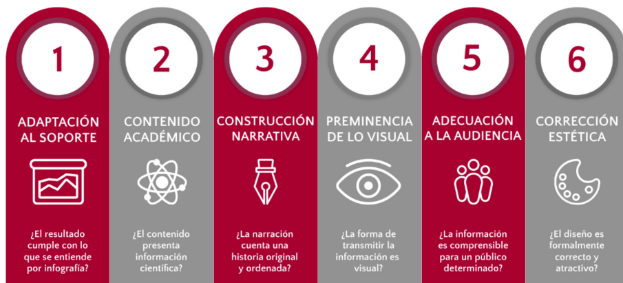
Figura 2. Ángel Pazos-López y Teresa Nava Rodríguez, Dimensiones para la tutorización de infografías científicas , 2021. Elaborado en Genially.

¿Qué elementos debo tener en cuenta para supervisar a mis estudiantes en el proceso de elaboración de infografías de contenido científico en el aula?