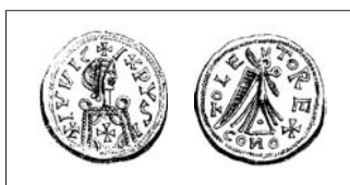
Fig. 1: Triente a nombre de Leovigildo, ceca Toledo. HEISS, 1872, pl. I-26