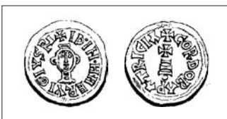
Fig. 4: Triente de Ervigio, ceca Córdoba. HEISS, 1872, pl. IX-4