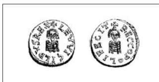
Fig. 2: Triente de Leovigildo, ceca Recópolis. HEISS, 1872, pl. I-23