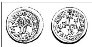
Fig. 5: Triente de Égica y Witiza, ceca Mérida. HEISS, 1872, pl. XI-5