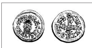
Fig. 3: Triente de Chindasvinto y Recesvinto, ceca Mérida. HEISS, 1872, pl. VIII-1