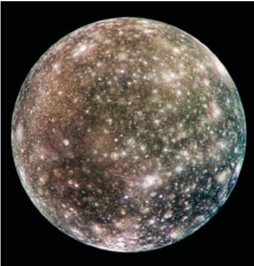
1. Fotografía de Calisto tomada por la nave Galileo en mayo de 2001, única imagen global en color del satélite tomada por esta sonda. En la imagen se observa que la superficie se encuentra salpicada de cráteres de impacto, lo que atestigua que su antigüedad se remonta a los primeros tiempos del sistema solar