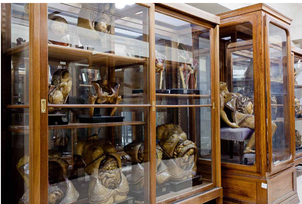
Fig.1 Detalle del Museo de Anatomía “Javier Puerta”. Facultad de Medicina. Universidad Complutense de Madrid.

La primera referencia documental a la colección se encuentra en el informe (1794) hecho por Antonio de Gimbernat y Arbós, eminente anatómico y cirujano, primer director del Real Colegio, creado por Reales Cédulas (1780 y 1787) de Carlos III. Fue elaborada por expreso deseo del monarca para dotarlo de modelos artificiales para instrucción de la juventud , a semejanza de otras instituciones europeas como el Museo Natural de Física e Historia Natural, conocido como La Specola de Florencia (1771). En el momento de su