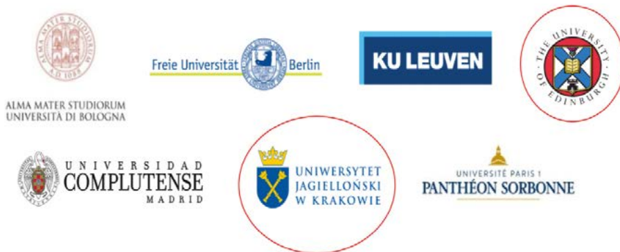
Figura 3. Ampliación de Una Europa

Mientras tanto, las cinco universidades empezaron a organizar actividades conjuntas que sirvieran de «entrenamiento» para trabajar como un campus transnacional (escuela de verano, doctoral workshops ) y también una staff week , conscientes de que para lograr que esta alianza funcionara, la involucración del PTGAS (Personal Técnico de Gestión y de Administración y Servicios) era tan importante como la del PDI (Personal Docente e Investigador).