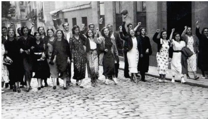
Trabajo "Las trece rosas"