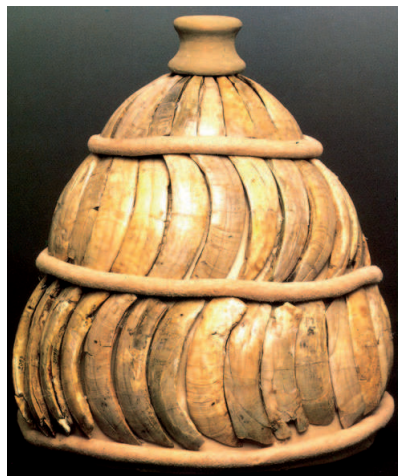
Casco de colmillos

Por sí mismo, el escudo proporcionaba una cobertura completa al soldado micénico, pero otro de los elementos esenciales de su equipamiento defensivo era el casco ( ko-ru ), ya que aquel no protegía la cabeza 14 . El modelo más característico, y del que conservamos restos no solo arqueológicos sino también pictóricos, es el llamado «casco de colmillos de jabalí» 15 . Para su fabricación se cortaban los colmillos de dicho animal en láminas rectangulares y, practicándoseles orificios en las esquinas para coserlos, se generaba la característica estructura cónica de este tipo de cascos. Solían constar de entre 4-5 hileras de colmillos, cuya dirección, en cuanto a la curvatura de estos, variaba en cada hilera, mientras que la parte más alta del casco terminaba en una pluma o en una pieza en forma de nudo, pudiendo o no incluir protecciones para las mejillas que también servían para mejorar su sujeción 16 . Existen numerosas representaciones gráficas de los cascos de colmillos de jabalí