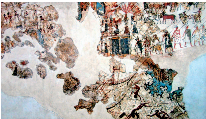
Soldados micénicos, frescos de Akrotiri en Thera

Los escudos utilizados por las tropas micénicas, y de los cuales nos ha llegado noticia, son básicamente de dos tipos: el ya mencionado y típico en forma de «8» y los de forma rectangular también llamados «de torre». Ambos se concibieron con la misión de proteger por completo el cuerpo del guerrero sacrificando con ello su movilidad, aunque el estilo de combate en formaciones cerradas ya la limitaba y hacía más útiles este tipo de escudos. Su elaboración se hacía con mimbre sobre una estructura de madera, cubriéndose con varias capas de cuero. Para su transporte se les añadían correas o telamón que los colocaba sobre el hombro izquierdo en diagonal para liberar ambas manos. Su enorme tamaño y su curvatura lateral (lo cual no sucedía en el de «torre») facilitaban la protección del guerrero ante todo tipo de armas, tanto de corta distancia, como espadas, dagas, etc., como de proyectiles tipo jabalinas, flechas o piedras lanzadas con hondas, aunque su elevado peso limitaba la movilidad del guerrero, siendo este su gran defecto, ya que les impedía correr o realizar movimientos rápidos.