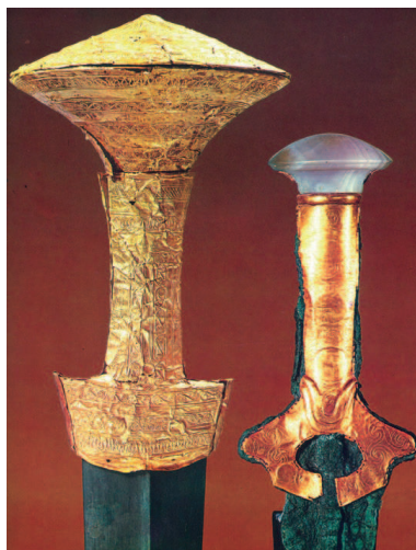
Pomos de espadas

Sería ya en el siglo XIII a.C., en los momentos finales de la cultura micénica, cuando en esos tiempos tormentosos las espadas utilizadas presentarían un nuevo desarrollo (tipos F, G y el Naue II) al elaborarse más cortas que las de periodos anteriores y un poco más anchas. Pero las dos mejoras más importantes son la sustitución de la nervadura central por un triángulo aplanado (que hace a la espada más sólida) y el desarrollo del filo recurvado (lo que hace una lámina en forma de hoja), cuya ventaja era que mejoraba la eficiencia de la acción de corte, especialmente el corte que acarrea desgarrar (donde se corta tirando hacia sí más que impulsando hacia delante), en combates que degeneraban en una melé.