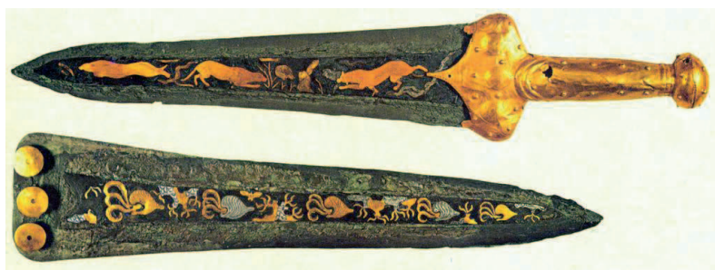
Espadas Círculo A 2