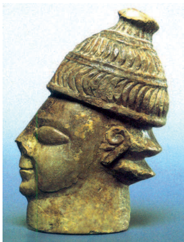
Cabeza de guerrero