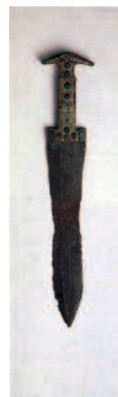
Cacería, espadas Círculo A