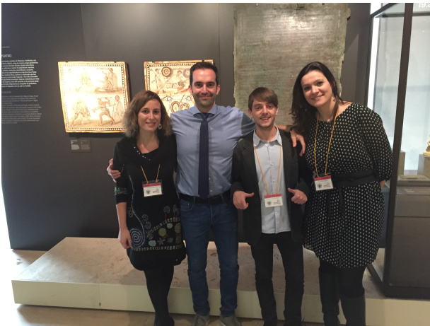
Los dos equipos, con el Coordinador del Proyecto