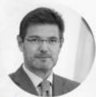
Rafael Catalá Socio de Carles Cuesta Abogados. Ex Ministro de Justicia