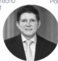
Conclusiones: Wilson Ruiz Orejuela Ministro de Justicia de Colombia