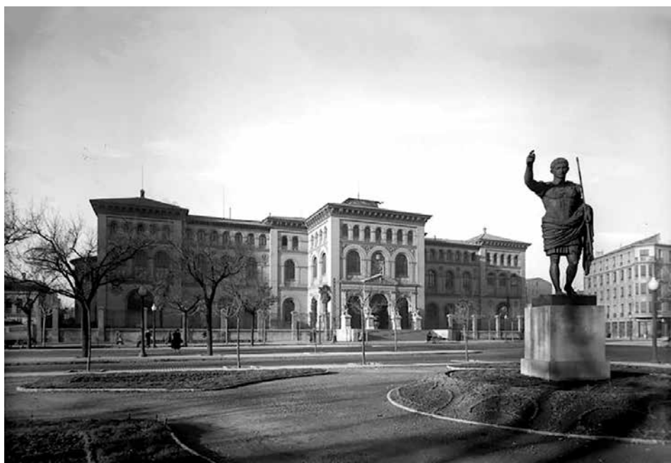
Plaza Basilio Paraíso presidida por la estatua de Augusto de Prima Porta que Benito Mussolini regaló a la ciudad de Zaragoza. Al fondo, puede verse el edificio que antiguamente albergaba las Facultades de Medicina y de Ciencias de la Universidad de Zaragoza.