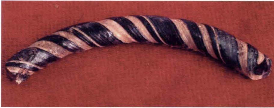
Figura 3. Pulseras de vidrio cordiformes.