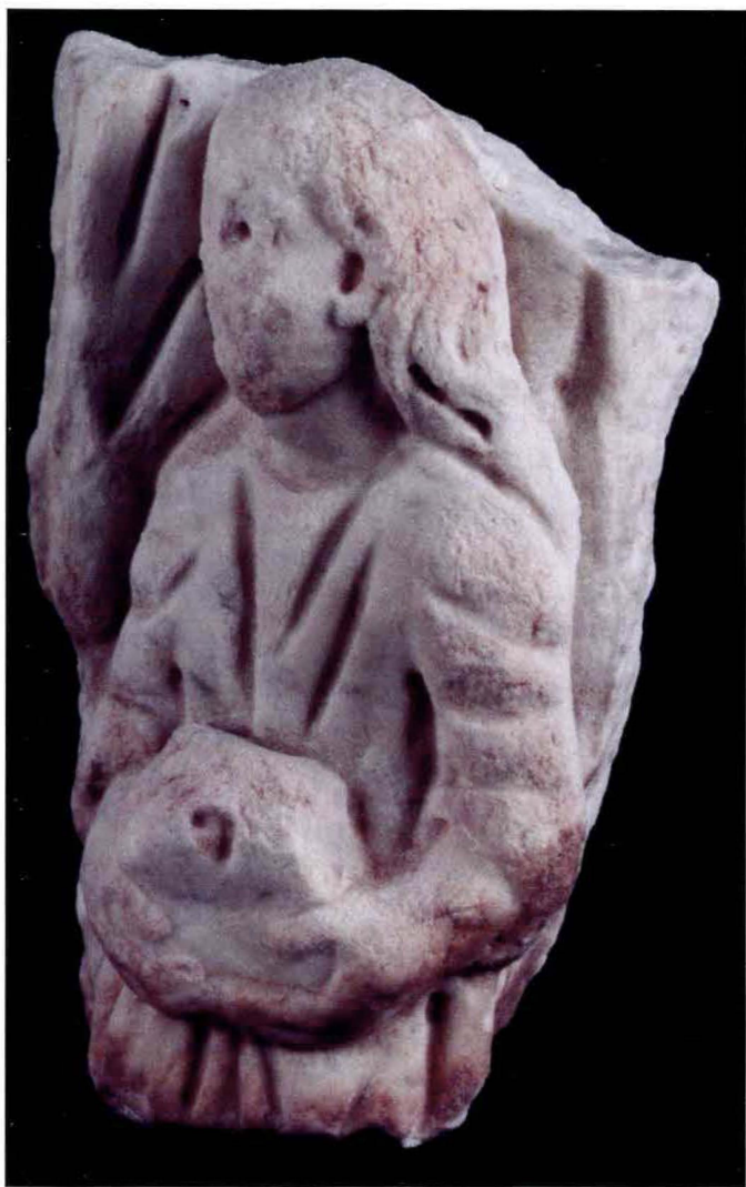
Figura 1. Fragmento de sarcófago en mármol. Figura femenina.

Se trata de un cofre, colocado sobre sus manos que se sitúan a la altura del regazo. El cofre presenta un signo en su frente, que pudiera ser la letra dalet del alfabeto hebreo. En ocasiones esa letra viene a significar puerta, o espacio de tránsito. La mujer se acerca hacia un lugar principal, que se situaría a su izquierda. Un árbol, al fondo, parece enmarcar la escena. Quizás nos encontremos ante un motivo iconográfico paleocristiano (Fig. 1).