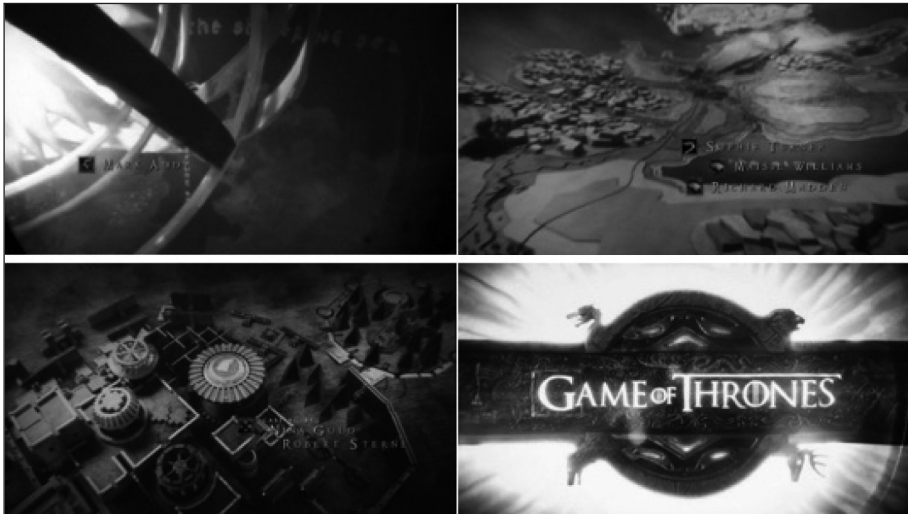
Figura 3. Fotogramas de la secuencia inicial de Juegos de tronos .

Todo se fue digitalizando y animando con gran realismo, adoptando la textura de elementos naturales como hierro, cuero, madera y tela, es decir, materiales propios de la construcción de objetos de la época. Incluso la tipografía parece estar forjada en oro. En definitiva, unos títulos de crédito técnicamente muy complejos cuyo resultado es muy espectacular y logra sumergir a los televidentes en un mundo imaginario y una época pretérita.