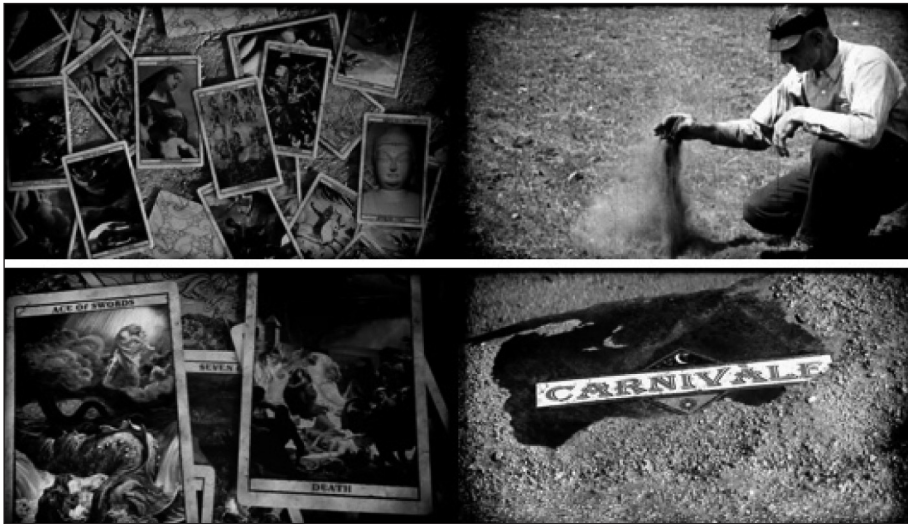
Figura 11. Fotogramas de la secuencia inicial de Carnaval .

La cámara va adentrándose en los dibujos de las cartas para dar paso a los momentos históricos en vídeo. Después retrocede para mostrar otra carta y dar paso de nuevo a la imagen en movimiento. Esta estructura se repite varias veces hasta que finalmente se muestran las cartas de Dios y el Diablo que dan paso, ante una polvareda de arena, al título de la serie.