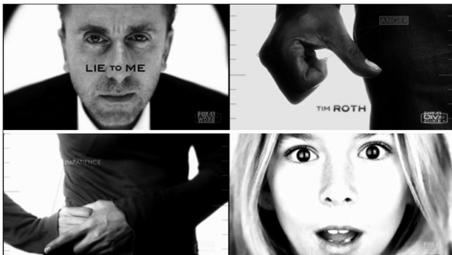
Figura 6. Fotogramas de la secuencia inicial de Miénteme .

El uso de la tipografía en pantalla es sencillo y delicado, cumpliendo una función señalética reforzada por el uso de líneas conectadas con las partes del cuerpo humano que indican las emociones, además de la función informativa del reparto.