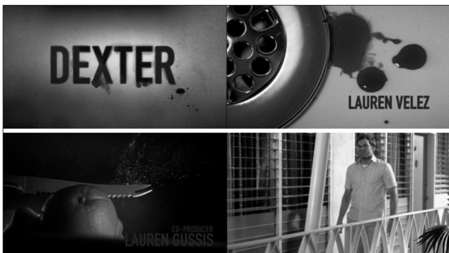
Figura 8. Fotogramas de la secuencia inicial de Dexter .

Esta secuencia mereció el premio Emmy 2007. Muestra la rutina aparentemente normal de una persona cuando se levanta por la mañana. Cada una de las acciones cotidianas como afeitarse, vestirse o prepararse en el desayuno contienen una alusión a diferentes formas de matar en una perfecta sincronía de planos detalle. Recogen a la perfección esa dualidad del personaje que de día encarna el hombre perfecto y que de noche se convierte en un asesino tomándose la justicia por su mano ( Art of the Title , 2010).