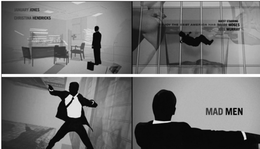
Figura 7. Fotogramas de la secuencia inicial de Mad Men .

La silueta negra representa al protagonista Don Draper, un creativo publicitario que vive en un mundo artificial y que se precipita al vacío.