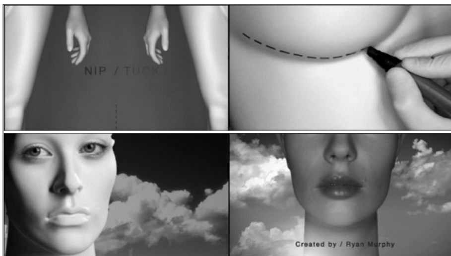
Figura 10. Fotogramas de la secuencia inicial de A golpe de bisturí .