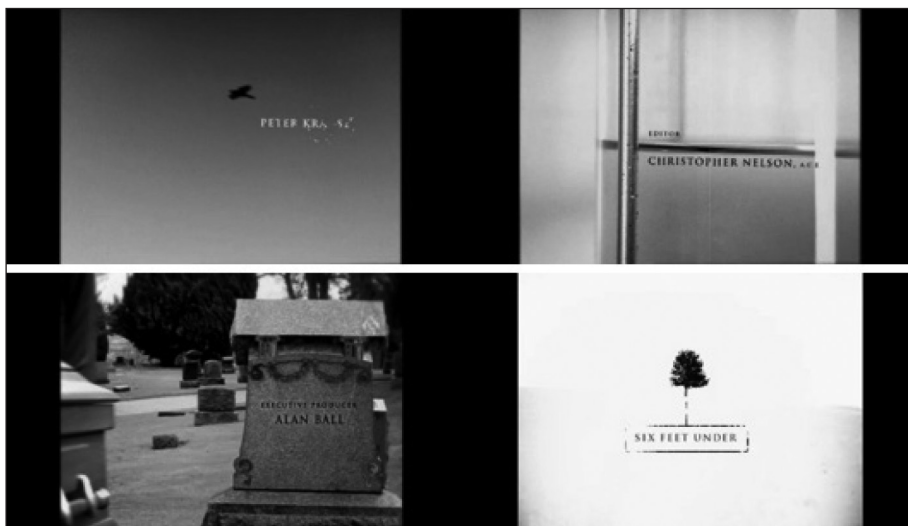
Figura 12. Fotogramas de la secuencia inicial de A dos metros bajo tierra .

cuadro, como, por ejemplo, la etiqueta de identificación de un cadáver o una lápida en un cementerio. También introducen un matiz interesante y lleno de mensaje en el tratamiento tipográfico, ya que los nombres de los actores desaparecen de la pantalla convirtiéndose en polvo en una clara alusión a la muerte. Los títulos terminan con una imagen sencilla y sintética que funciona como un logotipo o marca de la serie ( Art of the Title , 2008a).