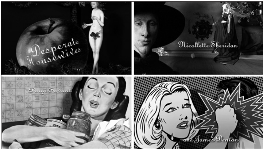
Figura 9. Fotogramas de la secuencia inicial de Mujeres desesperadas .

La técnica empleada es una mezcla de 2D y 3D que se denomina 2,5D , ya que presenta la animación de fotos estáticas dotándolas de movimiento y perspectiva.