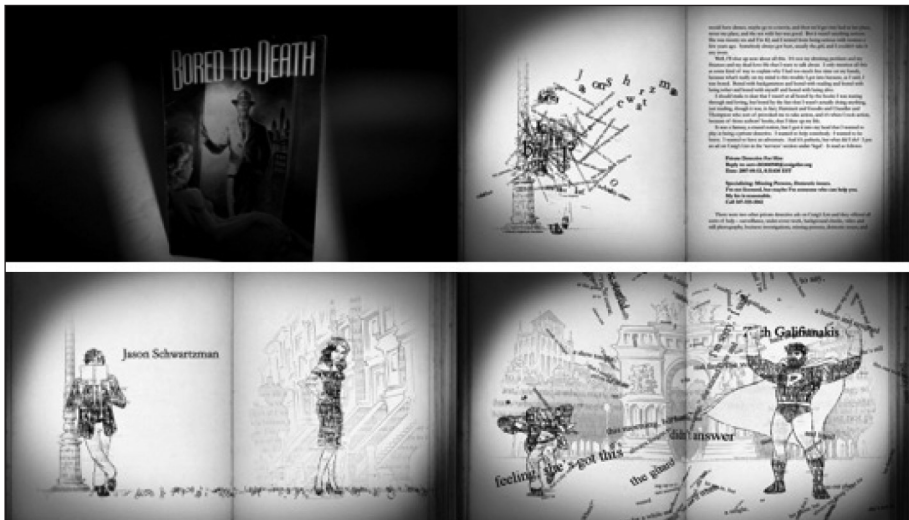
Figura 4. Fotogramas de la secuencia inicial de Muerto de aburrimiento .

Se realizó un trabajo previo muy importante de ilustración a modo de cómic tomando como referencias gráficas los tebeos de detectives y también de héroes ( Art of the Title , 2009a).