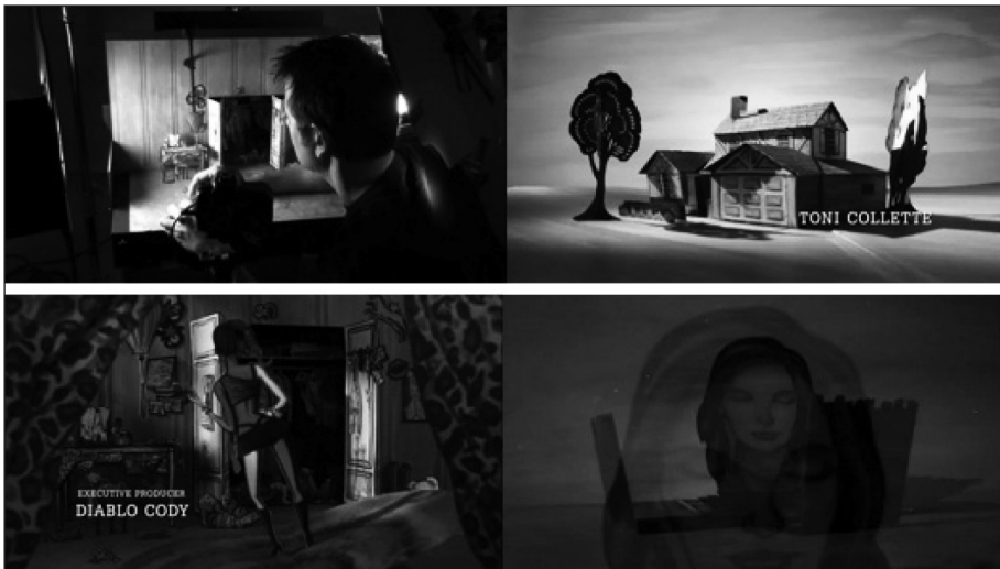
Figura 5. Fotogramas de la secuencia inicial de Los Estados Unidos de Tara .

Por el contrario, la grabación fue técnicamente más sencilla. Simplemente necesitaron dos cámaras fotográficas —una Canon 40D y una Nikon D300— y montaron los fotogramas en el software Dragon Stop Motion.