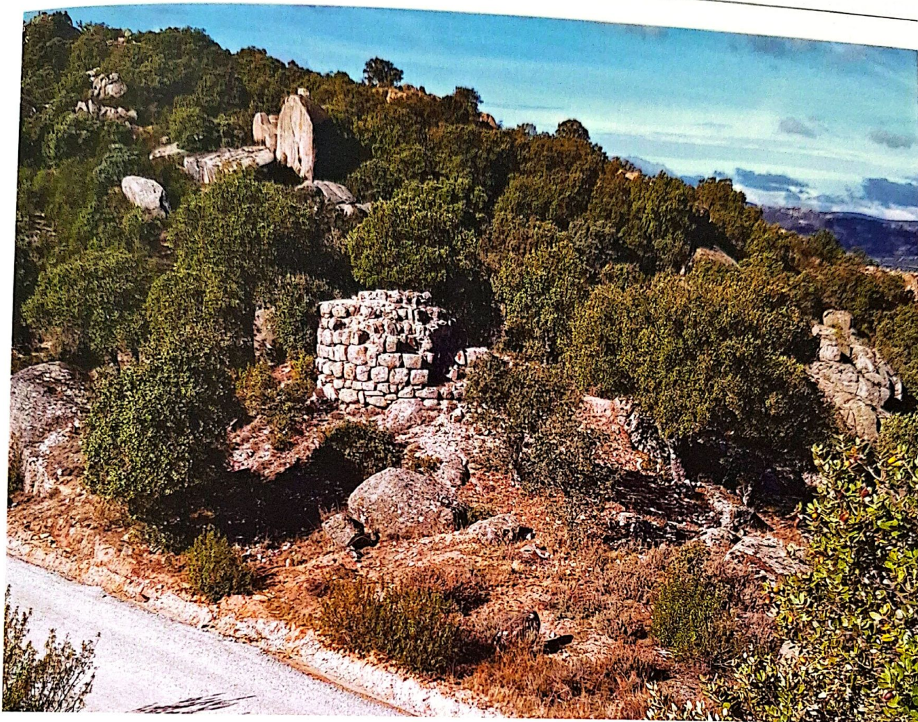
Figura 5. Vista de la Atalaya de la Torrecilla (Hoyo de Manzanares) donde se puede observar la tipología característica de las torres defensivas de la Marca Media en nuestra región, que fueron erigidas entre los reinados de Muhammad I y Abd-al-Rahman III.

cribe, casi en exclusiva, al área de la Marca Media. En otros momentos cronológicos y en otras regiones, las atalayas son siempre de planta cuadrada (Cressier 2022)