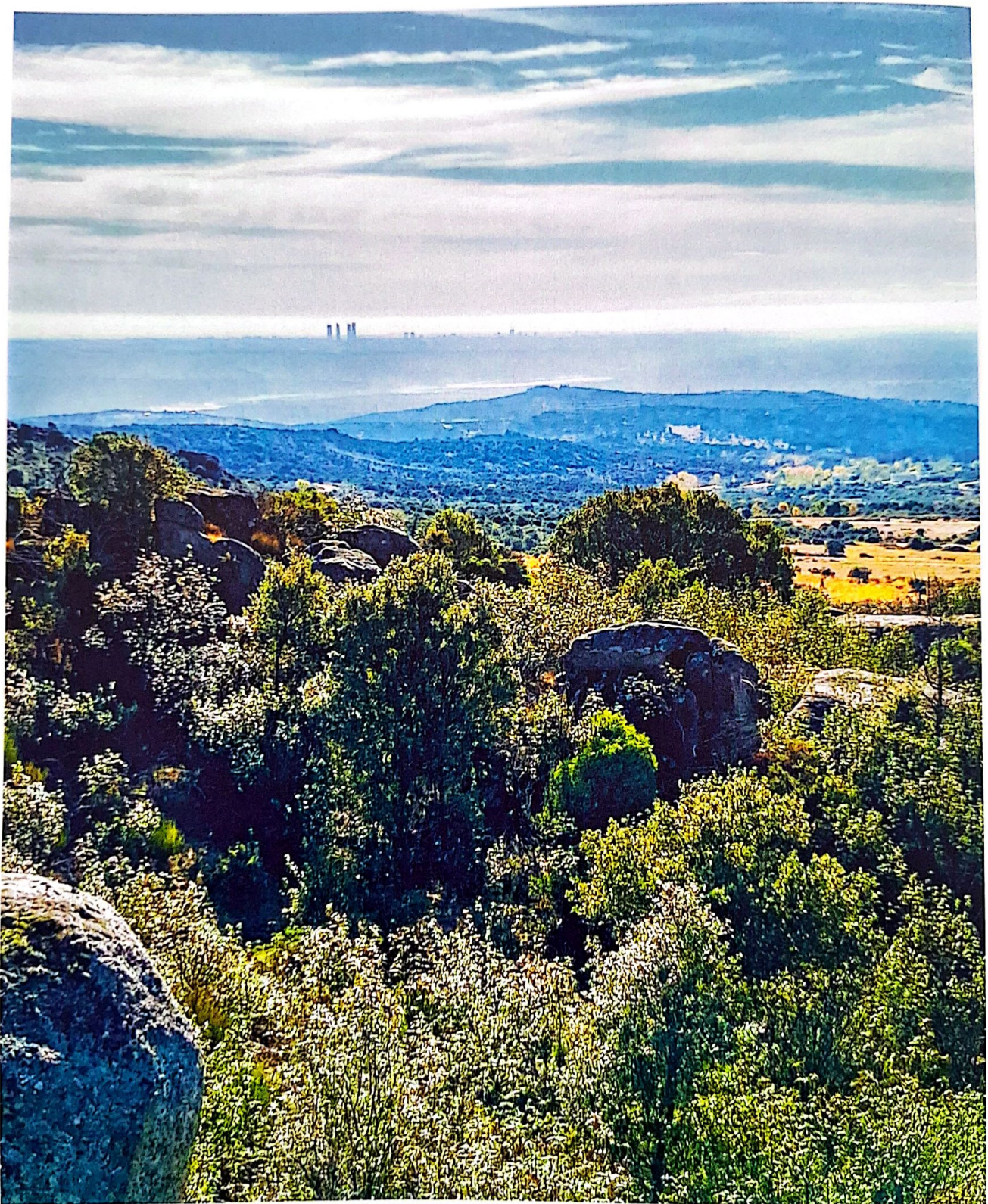
Figura 4. Panorámica desde la base de la atalaya de La Torrecilla con Madrid al fondo. Esto nos da una prueba irrefutable en cuanto a su situación de vigilancia tanto de la zona vecina de la sierra del a Pedriza como el control del lugar donde se ubicó Maýrīt.