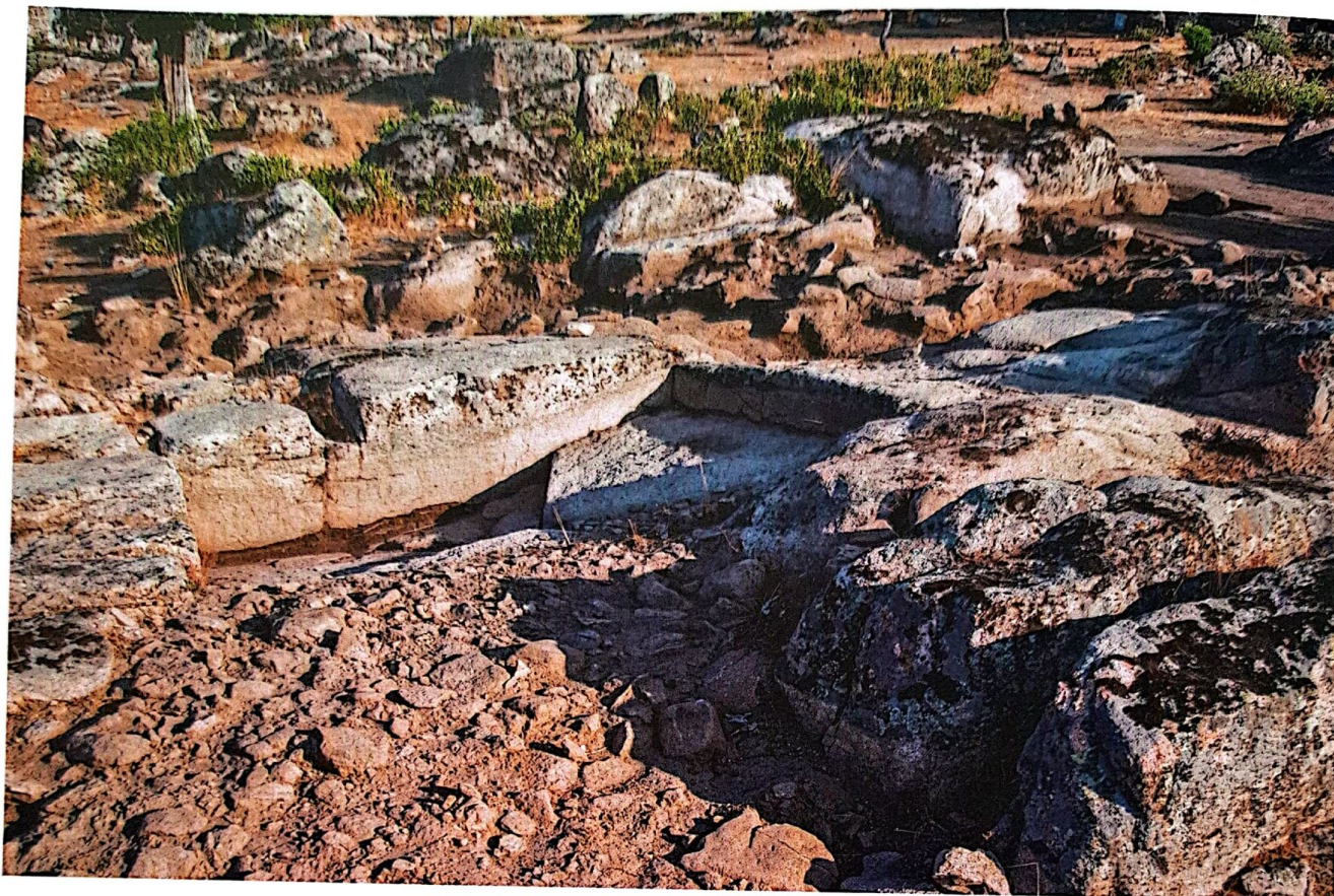
Figura 1. Vista del abrevadero emiral excavado en La Cabilda (Hoyo de Manzanares), inscrito dentro de un conjunto de construcciones de funcionalidad agropecuaria. En la parte inferior de la imagen aparece el enchachado o pavimento realizado a base de piedra, tejas rotas y arcilla, cuya finalidad era evitar que los animales de pezuña se escurrieran al ir a beber.