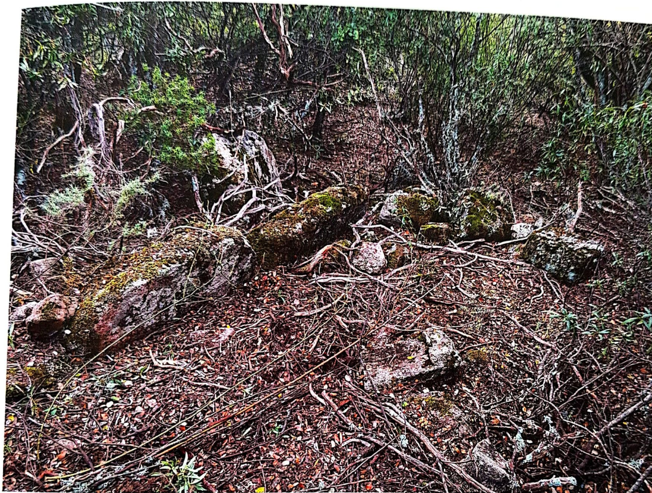
Figura 2. Vestigios de las construcciones semi-rupestres en el yacimiento de El Palancar (Hoyo de Manzanares), que emergen de entre la vegetación. El tipo constructivo caracterizado por grandes bloques, a modo de sillares, es peculiar del periodo emiral.

mina 2). Varias decenas de metros más arriba se pudo documentar la presencia de una necrópolis, reconocible merced a la vista parcial de parte de varias tumbas de adulto excavadas en la roca (Morillo, Durán y Salas 2023; Morillo, Durán y Salas, 2024).