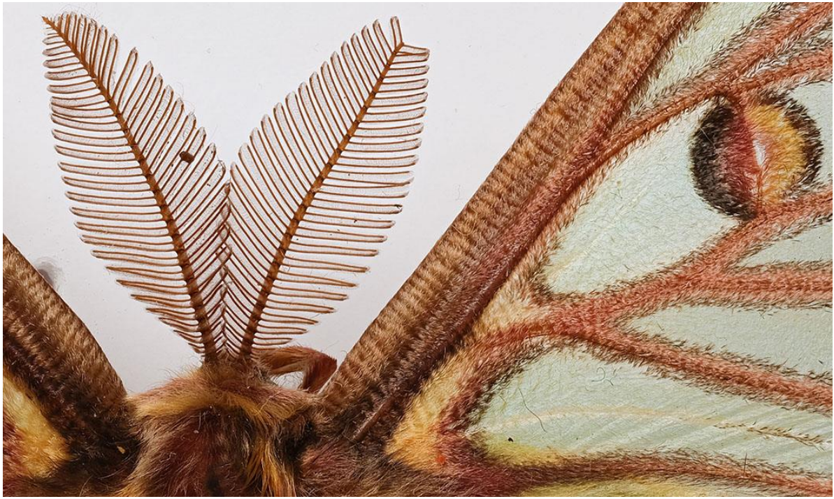
Fotografía 6. Detalle al 100% de ampliación de la imagen anterior.