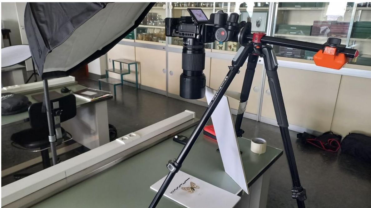
Fotografía 1. Set de iluminación y captura de la imagen.

A continuación incorporamos en este anexo imágenes de una de las sesiones y de algunos de los ejemplares fotografiados en diferentes vistas (dorsal y ventral) así como ampliaciones para verlos en detalle.