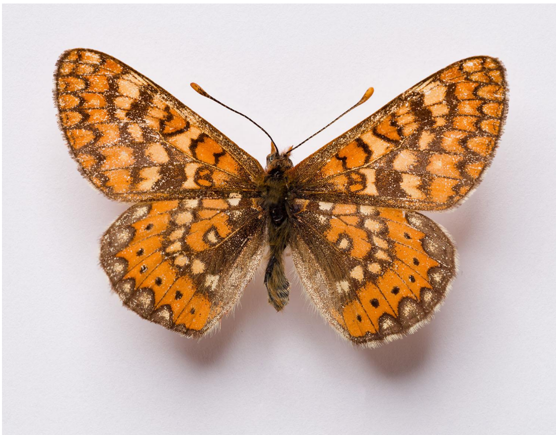
Fotografía 9. Euphydryas aurinia . Vista dorsal.