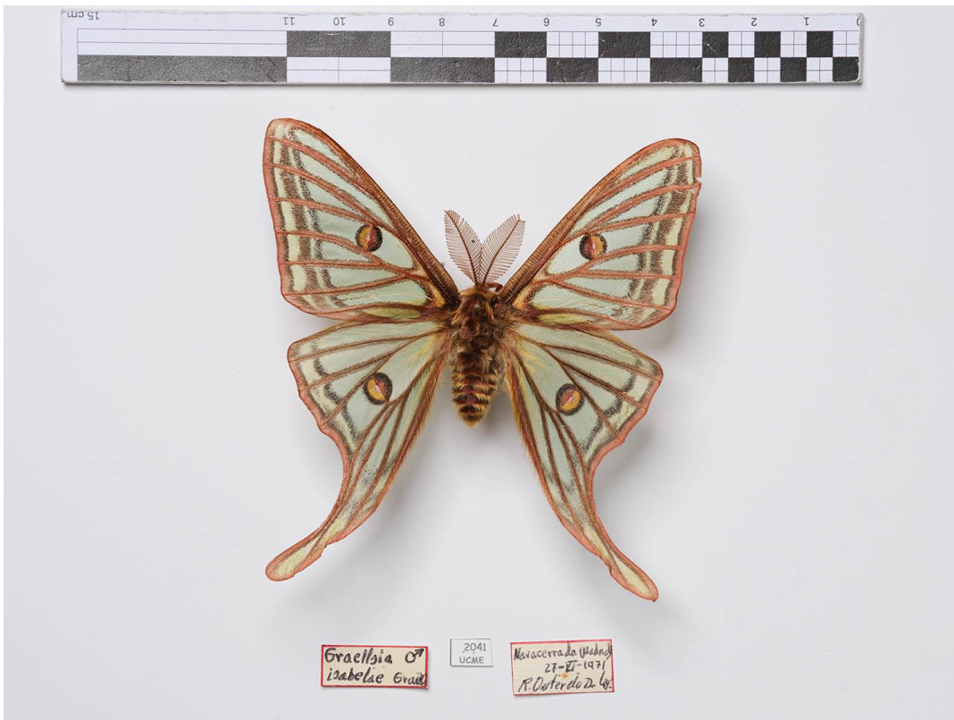
Fotografía 3. Graellsia isabellae . Macho. Vista Dorsal.