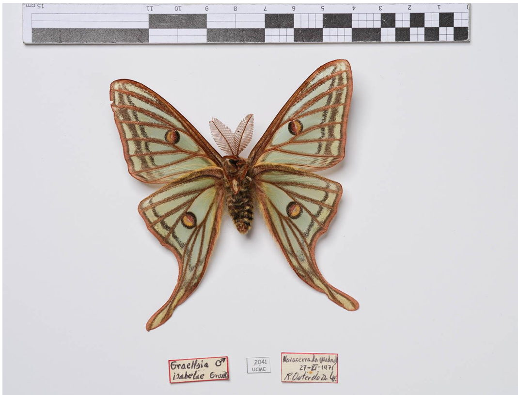
Fotografía 4. Graellsia isabellae . Macho. Vista Ventral.