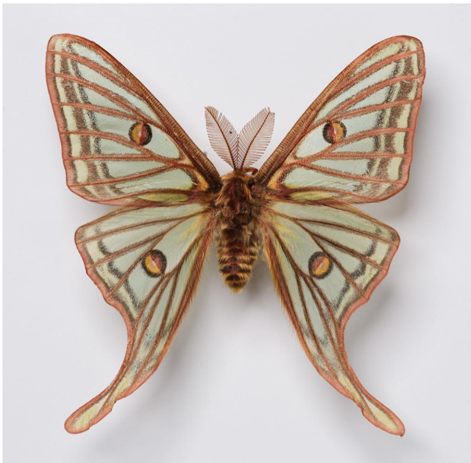
Fotografía 5. Graellsia isabellae . Macho. Vista Dorsal. Recortada y editada.