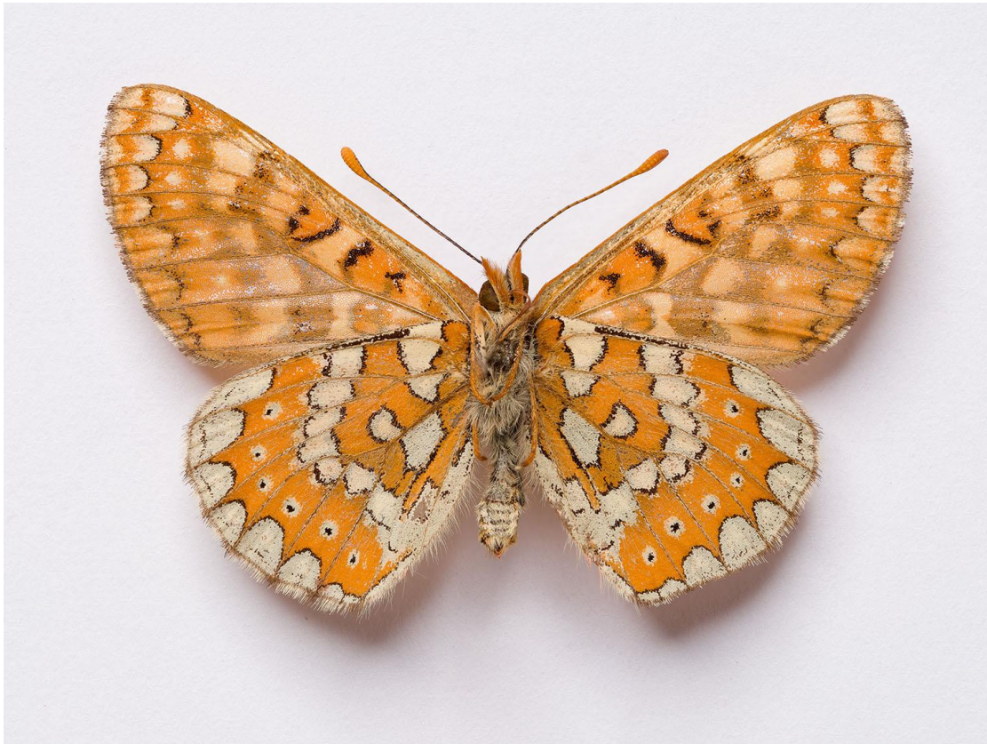
Fotografía 8. Euphydryas aurinia . Vista ventral.