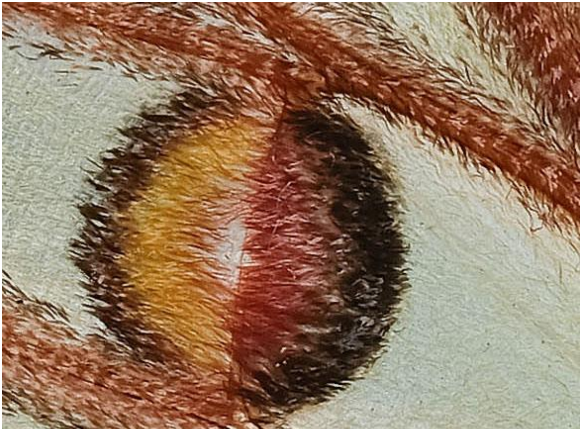
Fotografía 7. Detalle al 300% de ampliación de la fotografía número 3.