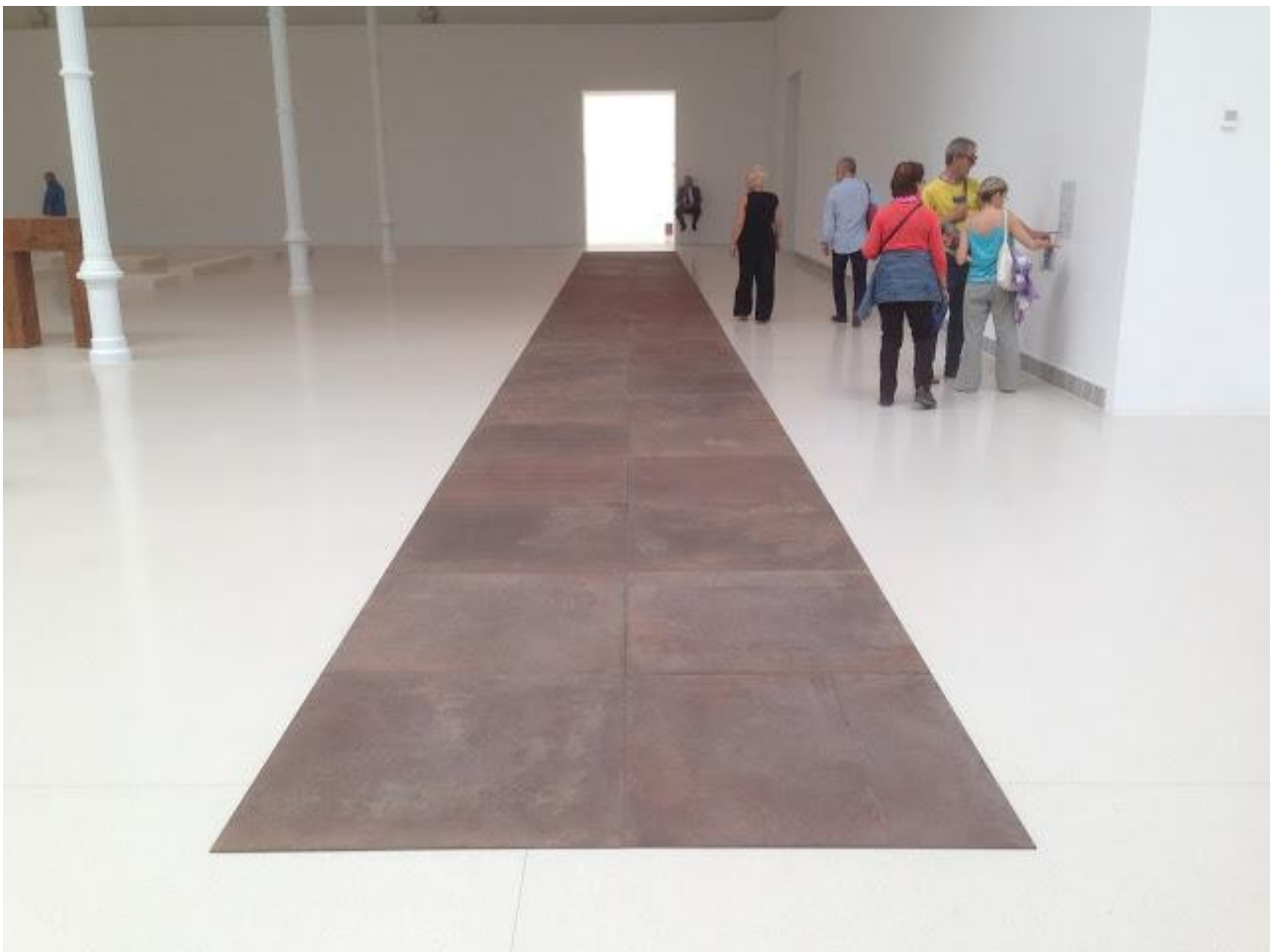
Carl Andre Escultura como lugar, 1958-2010.

secundaria. En todos los casos nos encontramos que maderas, metales, piedras, no han sufrido la transformación que caracteriza el diseño de artilugios de diferente índole. Se utilizan las planchas que dobladas y cortadas servirían para construir el casco de un buque, las vigas de madera que permitirían levantar la estructura de una construcción, las bobinas de cobre o estaño, incluso los ladrillos destinados a cerrar una estructura. En ese sentido los procedimientos constructivos de Andre se asemejan a los del arquitecto o ingeniero. Él escoge materiales -que a diferencia de la gran mayoría de los escultores nunca los manipula- conformados con una factura primaria para realizar una construcción, eso sí, no dotada de uso práctico en el sentido habitual que se da a este término. Pues no podemos soslayar las otras funciones menos evidentes desde el punto de vista de la rentabilidad material, derivadas de la obra de arte.