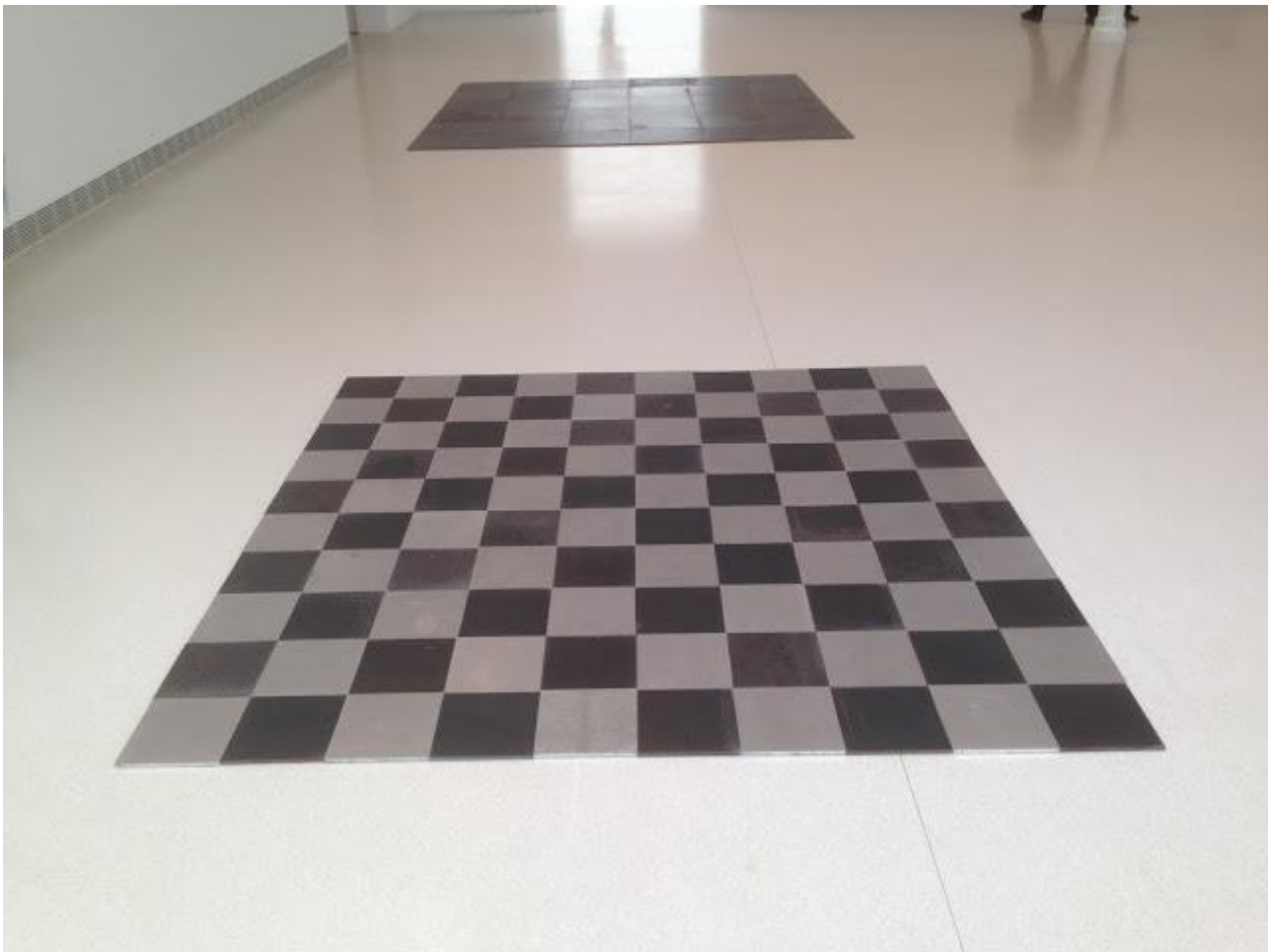
Carl Andre Escultura como lugar, 1958-2010.

físicas propias de las modificaciones de una diferente aleación o de una nueva precisión de corte del metal. Aun así, la conservación por tanto conlleva una hipocresía expositiva que nos propone que disfrutemos algo anulando las pautas de saborear la succulencia de su percepción; como si comiéramos cocina cantonesa con cuchillo y tenedor, como si acompañáramos un asado de lechazo con un vino de moscatel de La Marina, o como si viéramos un Seurat con gafas de sol. La percepción y la experiencia de la obra se transforma en simplemente testimonio.