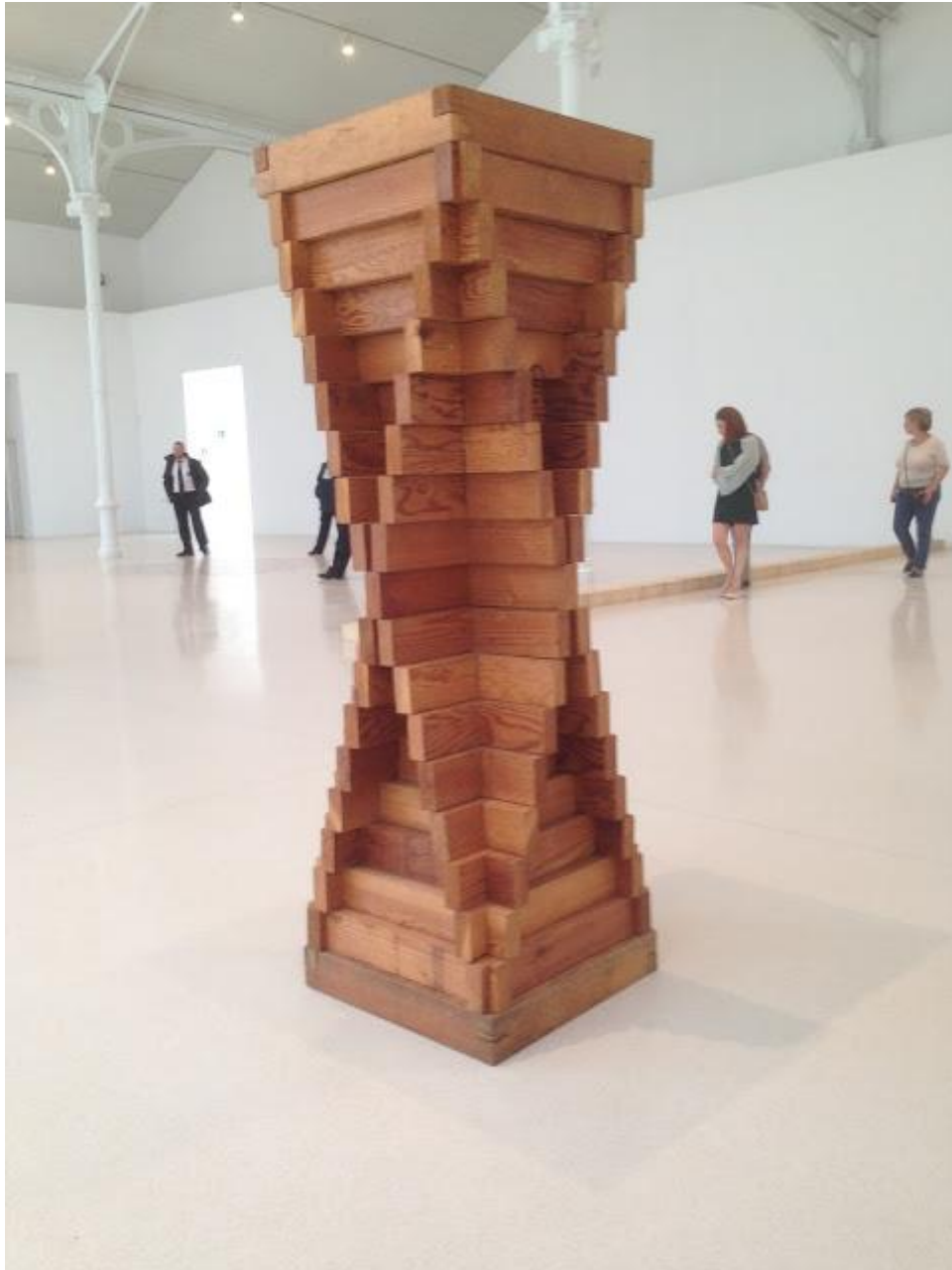
Carl Andre Escultura como lugar, 1958-2010.

“¡Ms obras no significan nada!” . Esa ausencia de significado dictaminada por el escultor, le sirve también para apuntalar su negativa a explicar algo de ellas, pese a que existen diversos argumentos expuestos por él que nos permiten conocer al menos algunas de sus intenciones. La decisión de ajustarse a la cotidianidad propia de los objetos más corrientes, parece alejar a las obras de los artistas minimal de lo que normalmente se entiende por contenido artístico. Fuera sentimientos, fuera narraciones, fuera subjetividades, fuera tragedias...para de ese modo subvertir la estructura de los valores existentes. Pero esa negación del contenido puede ser una afirmación de otra clase de contenidos