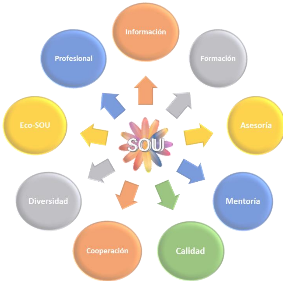
Figura 1. Estructura de las unidades del Servicio de Orientación Universitaria (SOU)