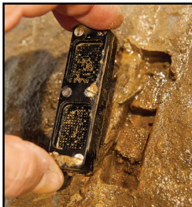
Imagen 1. El iChip es un dispositivo en miniatura, desarrollado por el equipo de Slava Epstein, el cual permite aislar y crecer células individuales en su entorno natural y, por lo tanto, proporcionar a los investigadores un mejor acceso a las bacterias de difícil cultivo. El iChip se utilizó para encontrar la teixobactina. Foto cortesía de Slava Epstein, Northeastern University, Boston, MA 5 .

microorganismo, pues el iChip actúa como una cámara de difusión, permitiendo incubar los microorganismos en su medio primordial 5 .