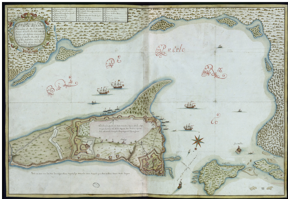
Figura 1. Puerto Rico puesto en planta Por Don Luis Venegas Ossorio Teniente del Castillo della Ciuda de Badajoz Yngeniero maior dela frontera de Extremadura y Sargento Gl. de batalla: por Mag. visitador Gl. de las fortificaciones de tierra firme y Costas del mar del Sur el año del Señor de 1678 años.

decoró el altar mayor con un retablo valorado en 600 ducados. Diseñó la planta de la iglesia y el convento de San Francisco, cuyas obras fueron realizadas por su sucesor y quedaron concluidas en 1653 y 1670 respectivamente 14 .