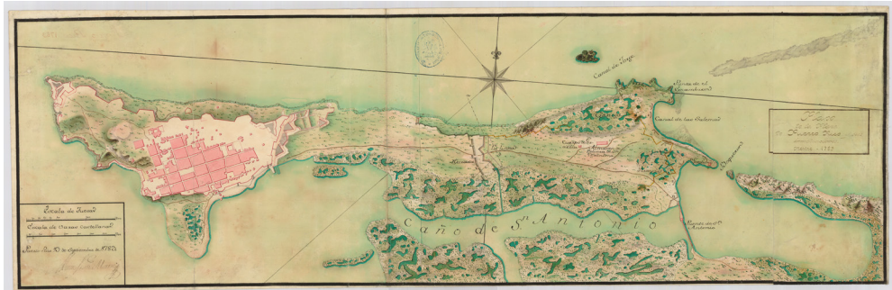
Figura 2. Plano de la plaza de Puerto Rico y sus inmediaciones . AGMM, Cartoteca, sig. PRI-15/9.