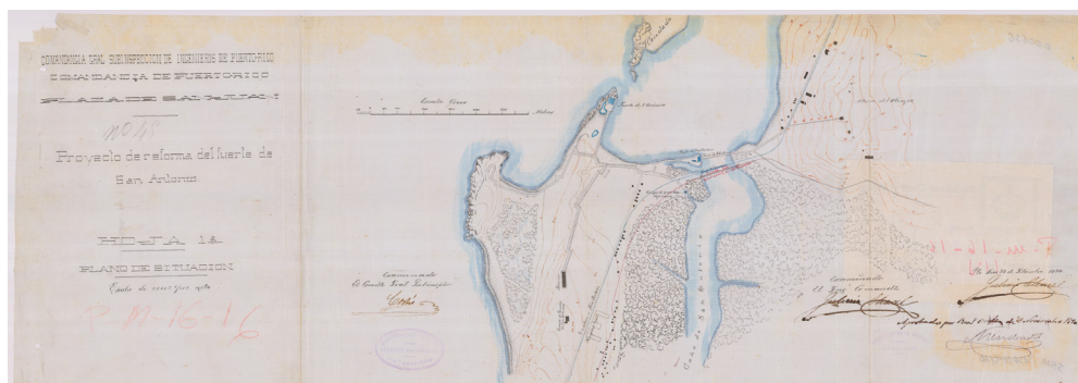
Figura 5. Proyecto de reforma del puente de San Antonio . AGMM, Cartoteca, PRI-25/3

fue destinado a Extremadura al mando del general Ramón Blanco, para participar en la sublevación de Badajoz. Un año después, concretamente el 17 de enero de 1884, fue destinado a Puerto Rico tras solicitar permiso al monarca para trabajar en el ramo de Obras Públicas 45 . Embarcó en Cádiz y llegó a la ciudad de San Juan el 12 de marzo. Durante los cuatro años que permaneció en la isla dirigió la construcción de varias obras defensivas y algunos edificios militares, realizó importantes reparaciones y obras de mejora en las defensas de Aguadilla, Arecibo, Mayagüez, Ponce y Vieques y propuso reforzar la defensa de la capital, mediante la construcción de una nueva batería en el castillo de San Felipe del Morro dotada de cinco piezas de artillería del calibre 24 e informó de la necesidad de realizar algunas reparaciones en los cuarteles de Santo Domingo y Ballajá, los puentes de Martín Peña y San Antonio y el Hospital Militar. Labor por la que fue nombrado ingeniero jefe y secretario de la comandancia general de subinspección el 22 de noviembre de 1886 y recibió la cruz sencilla de San Hermenegildo.