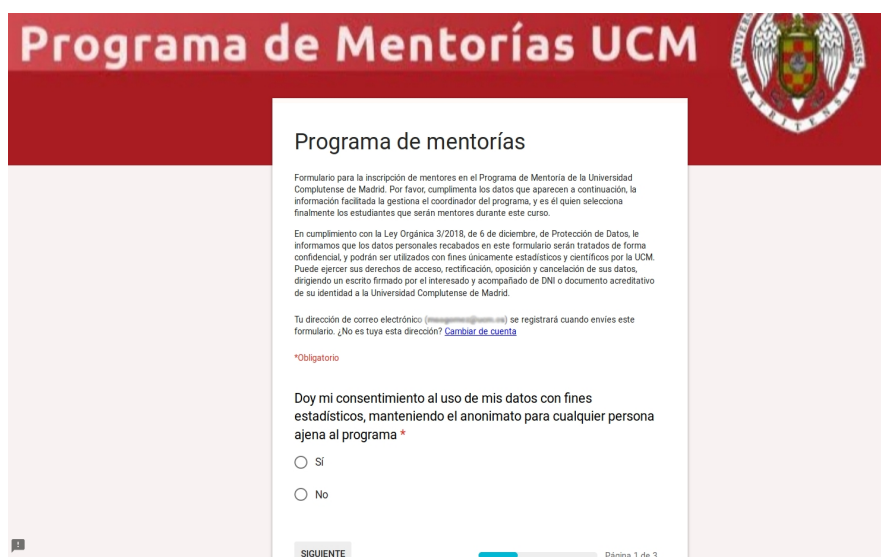
Figura 1: Formulario Google de captación de mentores

3.a. Formularios Google (Google Forms): Se utilizan para crear cuestionarios, tanto de captación de mentores y telémacos (Figura 1), como de seguimiento de las reuniones de mentoría entre mentores y telémacos (Figura 2). La información recopilada se almacena en Hojas de Cálculo Google (ver apartado 3.b). Los Formularios Google presentan la ventaja de que se pueden activar ciertas restricciones sobre los usuarios de dichos formularios, como, por ejemplo, que solo pueden acceder a ellos usuarios UCM y que sólo puedan contestar una vez cada uno de los cuestionarios. Así se pueden evitar la inclusión de datos falsos o duplicados que podrían distorsionar los resultados obtenidos.