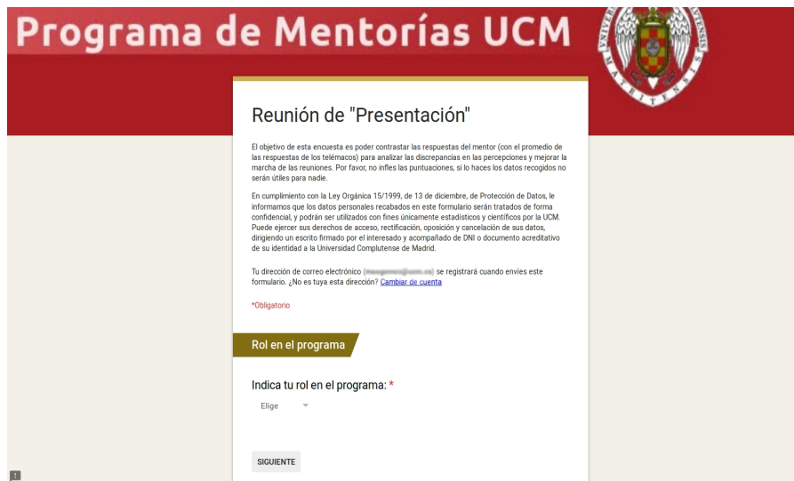
Figura 2: Formulario Google de seguimiento de la reunión de presentación

3.b. Hojas de Cálculo Google (Google Spreadsheets): Permiten almacenar la información recopilada en los cuestionarios y procesarla para la obtención de promedios y máximos y mínimos en las valoraciones incluidas en los cuestionarios o selección de la información aportada en base a determinados criterios (por ejemplo, pertenencia o no a una determinada Facultad, etc). Otra de las utilidades adicionales de las Hojas de Cálculo son la posibilidad de programar Secuencias de Comandos Google (ver apartado 3.c), que permiten crear nuevas Hojas de Cálculo enlazando entre ellas la información recogida con los cuestionarios. Esta información enlazada entre Hojas de Cálculo se va actualizando en tiempo real, de modo que un cambio en los datos almacenados en una Hoja de Cálculo es reflejado de forma inmediata en el resto de Hojas de Cálculo con las que esté enlazada. Un ejemplo de la información que se comparte con los mentores sobre las valoraciones promediadas de sus telémacos se puede ver en la figura 3.