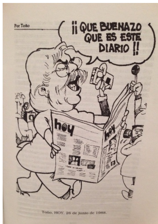
Esta caricatura, publicada en el Diario Hoy el 26 de junio de 1988, retrata al ex presidente de la República del Ecuador León Febres Cordero sosteniendo uno de los ejemplares del diario.

1988), que después de ser denunciado por corrupción 11 y crimen (caso de los hermanos Restrepo 12 , entre otros) continuó con el apoyo de los medios de comunicación como diario El Comercio , que “sirvió de instrumento ideológico para sostener un poder en decadencia” cuando a través del título “llamativo y amarillista: Todo el país con Febres-Cordero, con la democracia y contra el golpismo ”, intentó “cristalizar y condensar el respaldo y la solidaridad del conjunto de la sociedad ecuatoriana en una sola página de este periódico” (Tinell, 2008, p.147). Asimismo, el diario Hoy demostraba su apoyo incondicional al mandatario, hecho evidente en publicaciones como la siguiente: