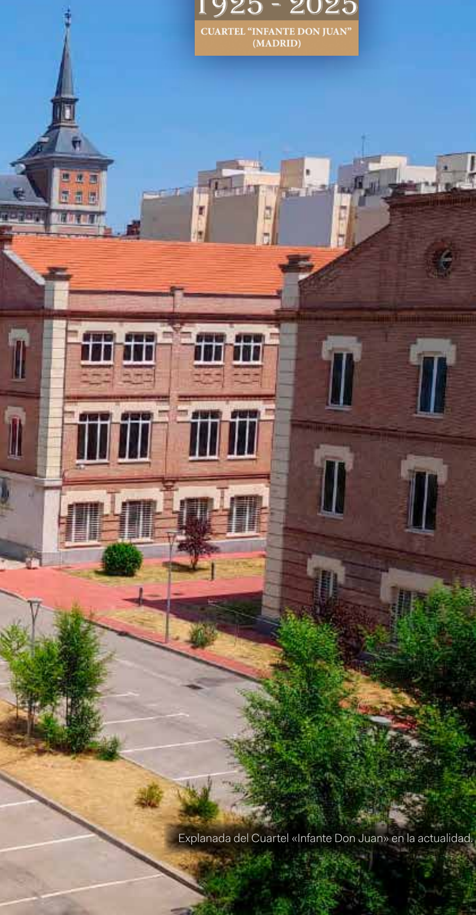
Explanada del Cuartel «Infante Don Juan» en la actualidad.

El cuartel «Infante Don Juan», inaugurado en 1925 en el paseo de Moret de Madrid, constituye un ejemplo paradigmático de la arquitectura militar española del siglo xx y un testigo privilegiado de la evolución social, política y urbana de España. Visitar sus instalaciones equivale a hacer un recorrido exhaustivo por los factores que motivaron su construcción, su desarrollo arquitectónico, las unidades y las personas que lo han habitado, su papel durante la Guerra Civil, los retos de conservación y los usos contemporáneos, destacando su relevancia como patrimonio histórico, artístico y documental para las Fuerzas Armadas y la ciudad de Madrid.