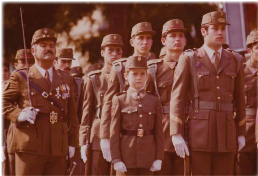
Filiación del príncipe de Asturias como Soldado de Honor en el cuartel en 1977