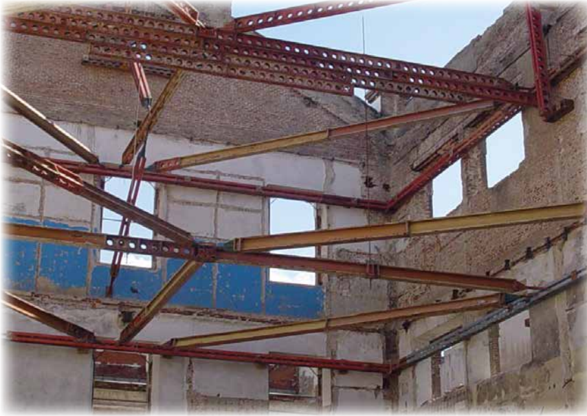
Encofrado del interior de un pabellón durante las obras de rehabilitación

León Sanchiz Pavón y se aprobó por real orden en agosto de 1919, con un presupuesto de casi cuatro millones de pesetas y un plazo de ejecución de dos años y medio.