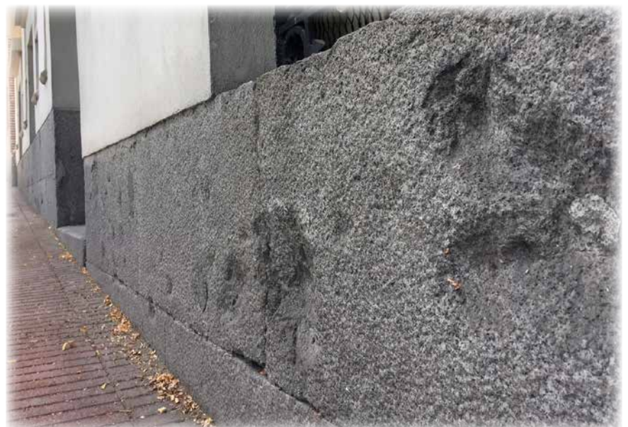
Restos de metralla aún visibles en la fachada principal del cuartel

La construcción se llevó a cabo en cinco años tras un proyecto en el que se emplearon, según el Memorial de ingenieros de junio de 1920, «poco más de dos meses en formar el proyecto, cerca de otros dos en obtener la real aprobación y seis, aproximadamente, en el trámite reglamentario para conseguir el real decreto autorizando el gasto», y se pretendía que tuviera unas instalaciones modernas y funcionales que mejoraran notablemente las condiciones de vida y trabajo de los soldados. Sanchiz supo integrar las ideas del ingeniero francés Casimir Tollet, pionero en la concepción de