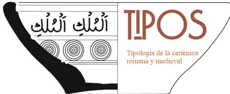
Logo del proyecto