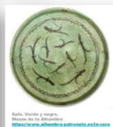
Sala. Verde y negro. Museo de la Alhambra http://www.alhambra.com/visitando/la-sala-verde-nazari