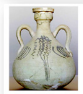
Jarro-cantimplora. Decoración Pintada. Museo de la Alhambra http://legadonazar.blogspot.com/2014/01/ceramica-nazari.html