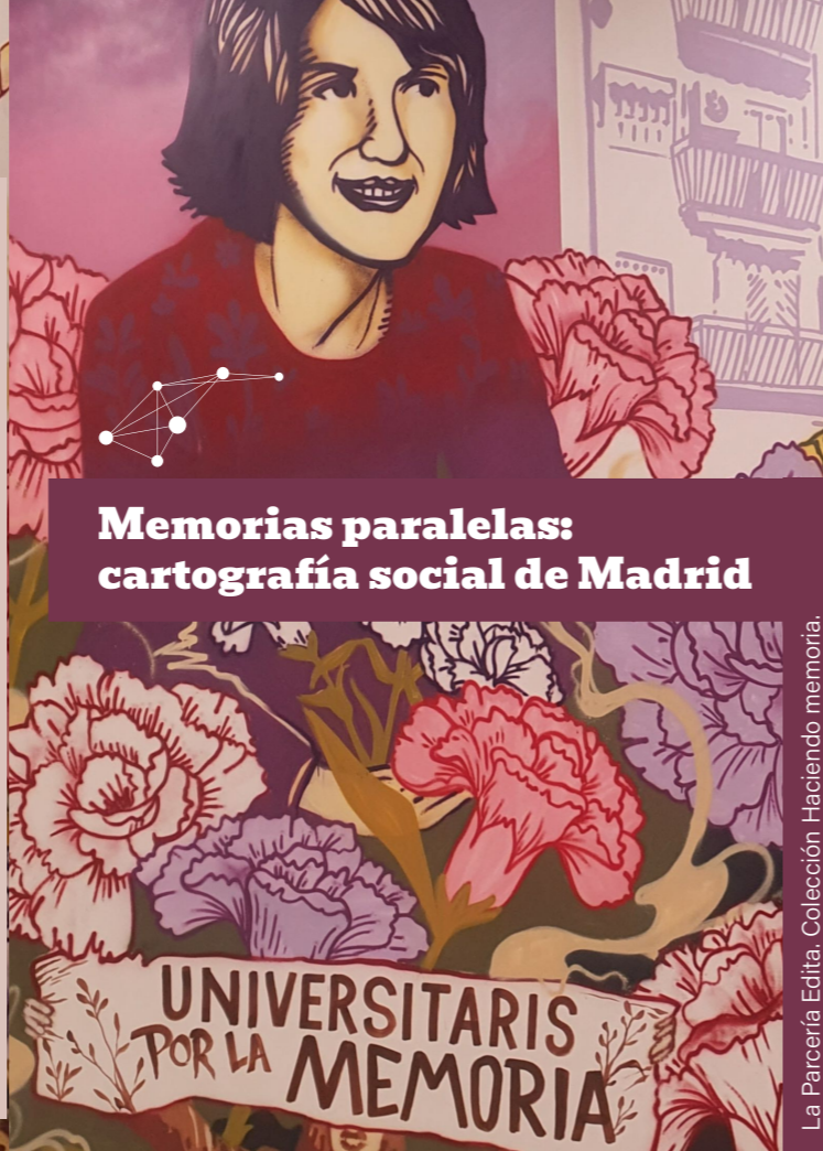
La Parcería Edita. Colección Haciendo memoria.

"Memorias paralelas: cartografía social de Madrid" es un proyecto de innovación docente con estudiantes de la Facultad de Políticas y Sociología de la UCM, que propone una lectura social y política del espacio público de la ciudad. Este mapa de Madrid se realiza con la mirada puesta en las huellas (visibles y borradas) de la represión y la resistencia en el Tardofranquismo y la Transición. La cartografía resultante se centra especialmente en dar visibilidad a la historia silenciada, dando continuidad a la lucha contra el olvido y la impunidad; e identificando los vínculos existentes entre el territorio y los relatos sobre el pasado.