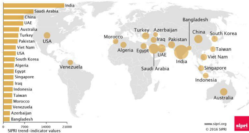
The 20 largest arms importers 2011–15

Esta débil consistencia y escasa iniciativa en una posición propia muestra la falta de arraigo de las acciones exteriores, aisladas de una estrategia regional total, guiadas en gran medida por un conjunto de consideraciones pragmáticas 35 .