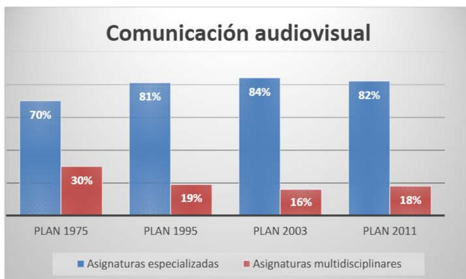
Gráfico 3. Evolución de los planes de estudio en Comunicación Audiovisual en la Universidad Complutense.

La mayor tasa de especialización (84%) fue alcanzada por las carreras de Comunicación Audiovisual y Publicidad y Relaciones Públicas en el plan del año 2003. Estas dos titulaciones presentan la misma proporción en cuanto al eje temático de contenido aplicado (especialización frente a multidisciplinariedad de las materias) en tres de los cuatro planes de estudio, no ocurriendo lo mismo con el del año 1995 probablemente por la diferencia en cuanto al número de créditos entre ambas.