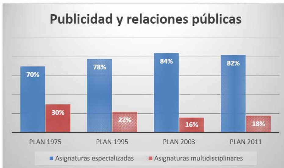
Gráfico 2. Evolución de los planes de estudio en Publicidad y Relaciones Públicas en la Universidad Complutense.