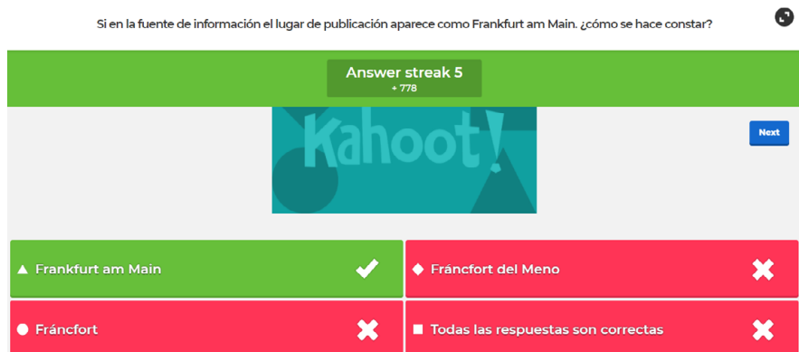
Figura 4. Ejemplo de pregunta Kahoot perteneciente al Módulo 4

Las preguntas fueron agrupadas en diez módulos temáticos que se relacionan casi íntegramente con la estructura de la edición consolidada de las normas de Descripción Bibliográfica Internacional Normalizada (ISBD), documento que especifica los elementos descriptivos necesarios para identificar y seleccionar un recurso a nivel mundial.