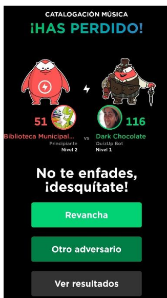
Figura 1. Captura de la pantalla final del juego de preguntas en QuizUp

Desde el punto de vista de las prestaciones Quizizz y Socrative obtuvieron la puntuación más elevada. La primera sobresale por su mayor variedad de tipos de preguntas que se puedan combinar en la versión de no pago (respuesta única, opción múltiple, rellenar espacio en blanco, abierta y encuesta) y por la posibilidad de incorporar memes personalizados en cada una de las respuestas.