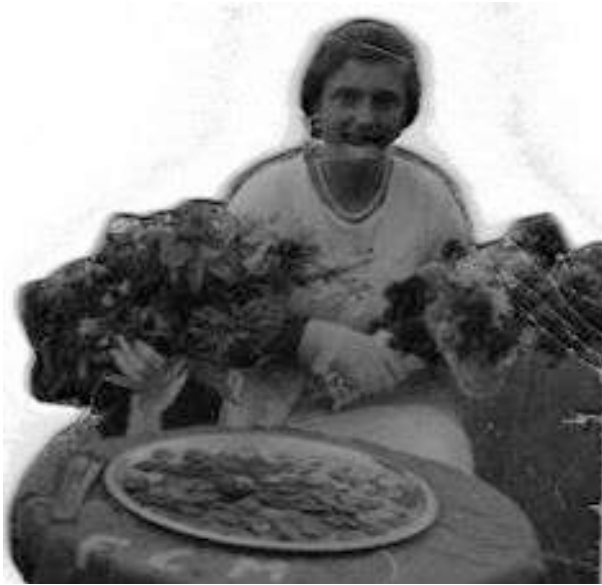
Sole con 16 años

salió de repente, no podía más. Yo me acuerdo que llevaba todavía el pico y la pala, cargada al hombro, y que íbamos bajando ya desde Pedralbes (...) Y cruzando la calle de Montaner me salió una mujer que era el clásico tipo de mujer reaccionaria, con un velito puesto, el misal en la mano y el rosario. Esto en guerra no se había visto ni por asomo. Me topo de narices con ella, y a mí me pareció como una momia desenterrada. Y qué cara de asombro pondría, que entre ella y yo se creó un coloquio, algo así de raro. Recuerdo que me dijo, refiriéndose al