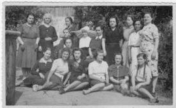
Foto hecha en la prisión de Barcelona llamado, los Cortes En el Pátio el año 1948. Este era un grupo de Profesoras y ayudantas, me fue el piso que hacia yo ahí. Este lugar había sido colegio de señoritas pero con la República había destruido la cárcel de mujeres adaptaron este escuela que tenía una capaci- dad de 300 el llamado a estas carceres