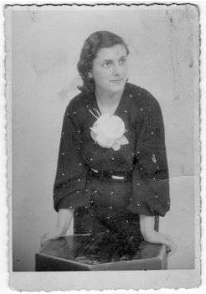
Sole a los 17 años

hora de la comida, los (tranvías) que estaban allí salían cargados a tope- y en el cruce, al cruzarse los tranvías, cogieron a uno... bueno, lo dejaron como una cucaracha muerta. La gente del tranvía pidiendo socorro y todo eso. Entonces todos los vecinos bajaron y tuvieron que sacar al hombre enganchando los tranvías y volcándolos sobre la acera para abrir y poder sacar al chaval que estaba allí. Lo sacaron muerto (...). Cogieron todos los vecinos y dijeron: ¡pues estos (tranvías) no entran más aquí a los Baños Orientales! Porque los Baños Orientales además tenían unas piscinas enormes, y claro, los que vivíamos en los últimos pisos (de las casas de la Barceloneta) no veíamos agua en esos tiempos porque continuamente estaban renovando las aguas de las piscinas, porque era de todo lujo. Entonces los Baños Orientales se permitían el lujo de que los tranvías les llevaban la gente y se la dejaban en la puerta, claro por la comodidad (...). Pues aquel domingo, me acordaré toda la vida, mi padre, mi hermano, todos los del (club) Avanti allí arrancando los adoquines y quitando los rieles del tranvía, y hasta que llegaron al Paseo, arrancando adoquines se tiró todo el barrio, sumando la gente, y allí se quitaron. Y no han vuelto a pasar los tranvías por allí (...) 8)